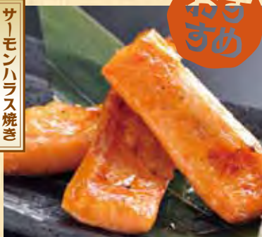
サーモンハラス焼き