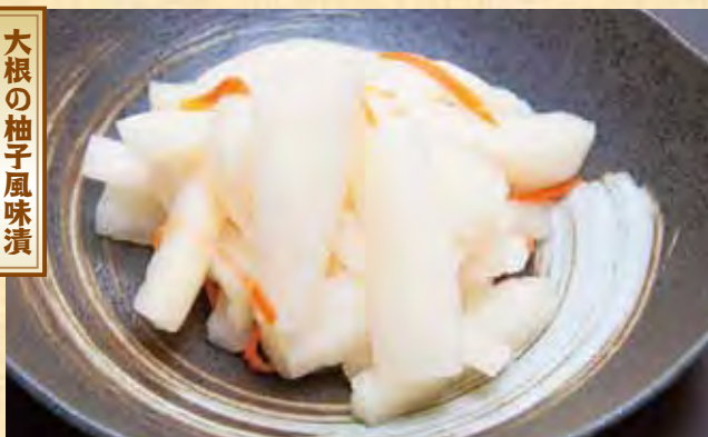
大根の柚子風味漬