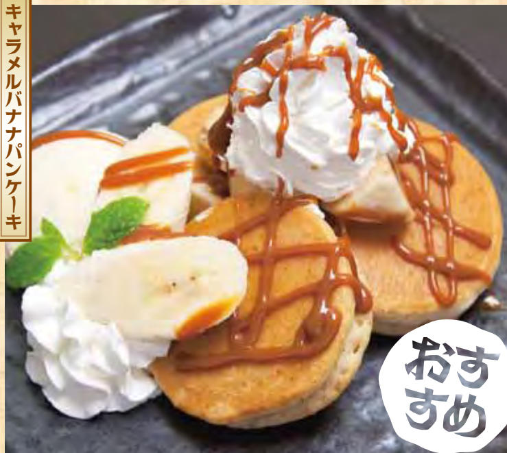
キャラメルバナナパンケーキ