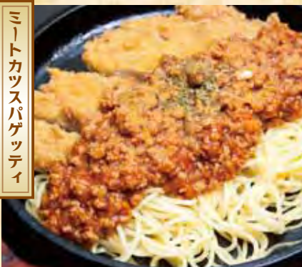
ミートカツスパゲッティ