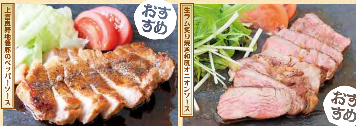
上富良野地養豚のペッパーソース