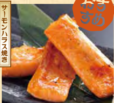
サーモンハラス焼き