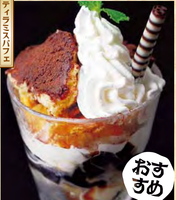
ティラミスパフェ