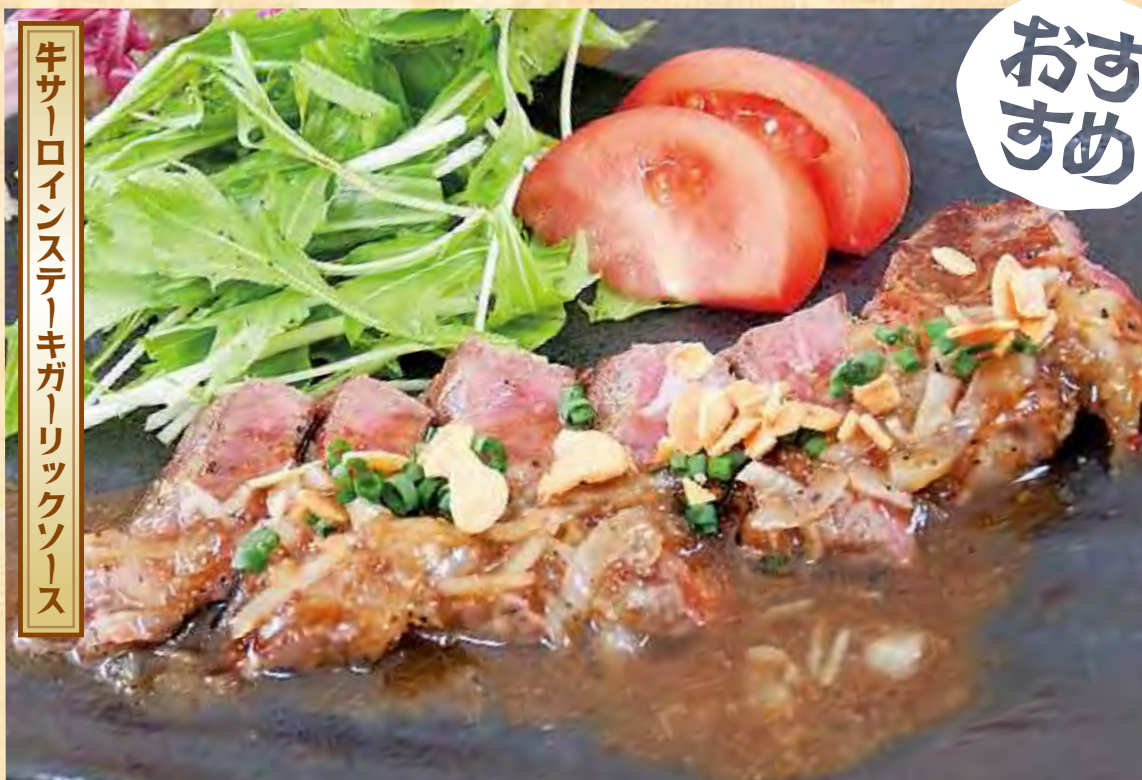
牛サーロインステーキガーリックソース