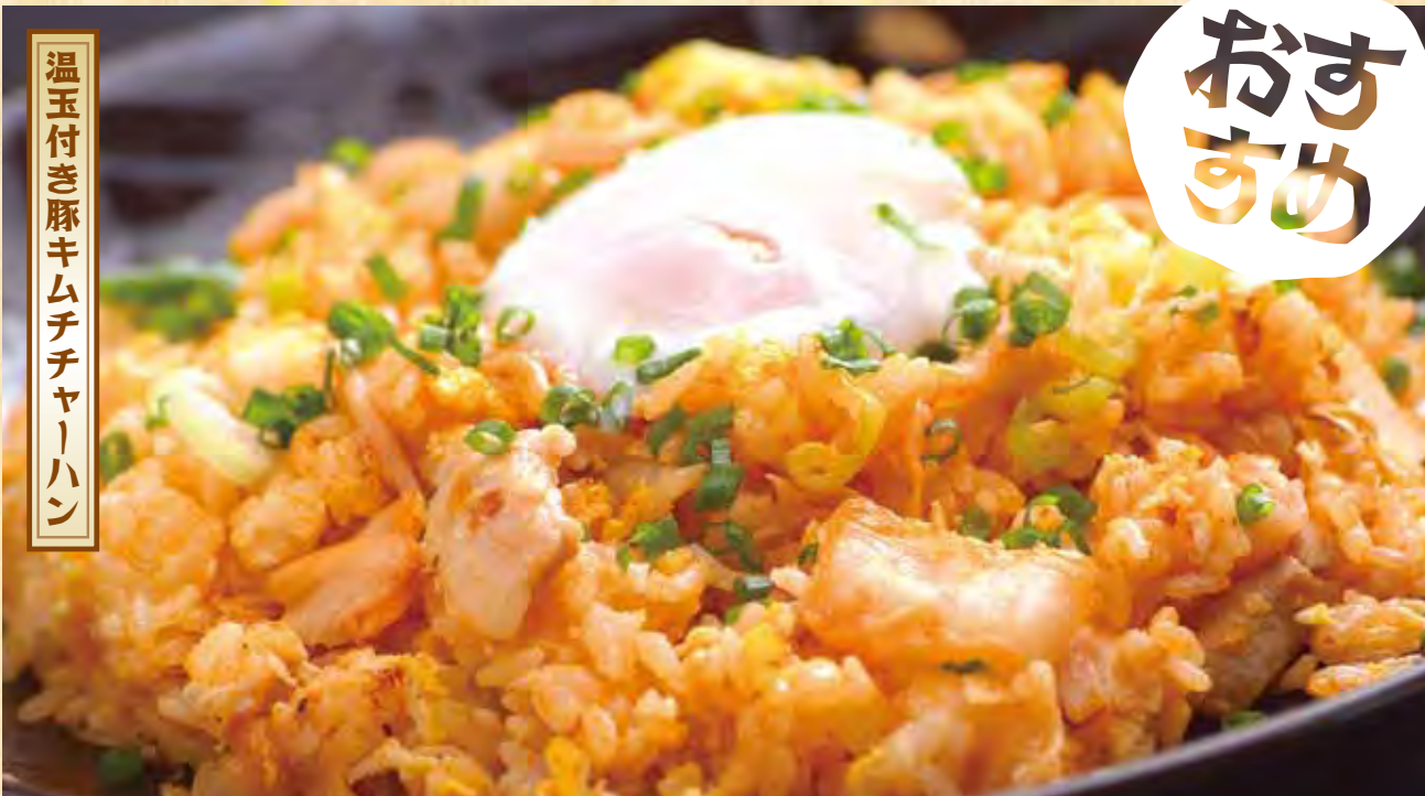
温玉付き豚キムチチャーハン