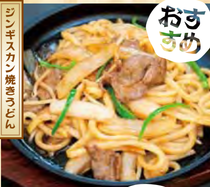
ジンギスカン焼きうどん