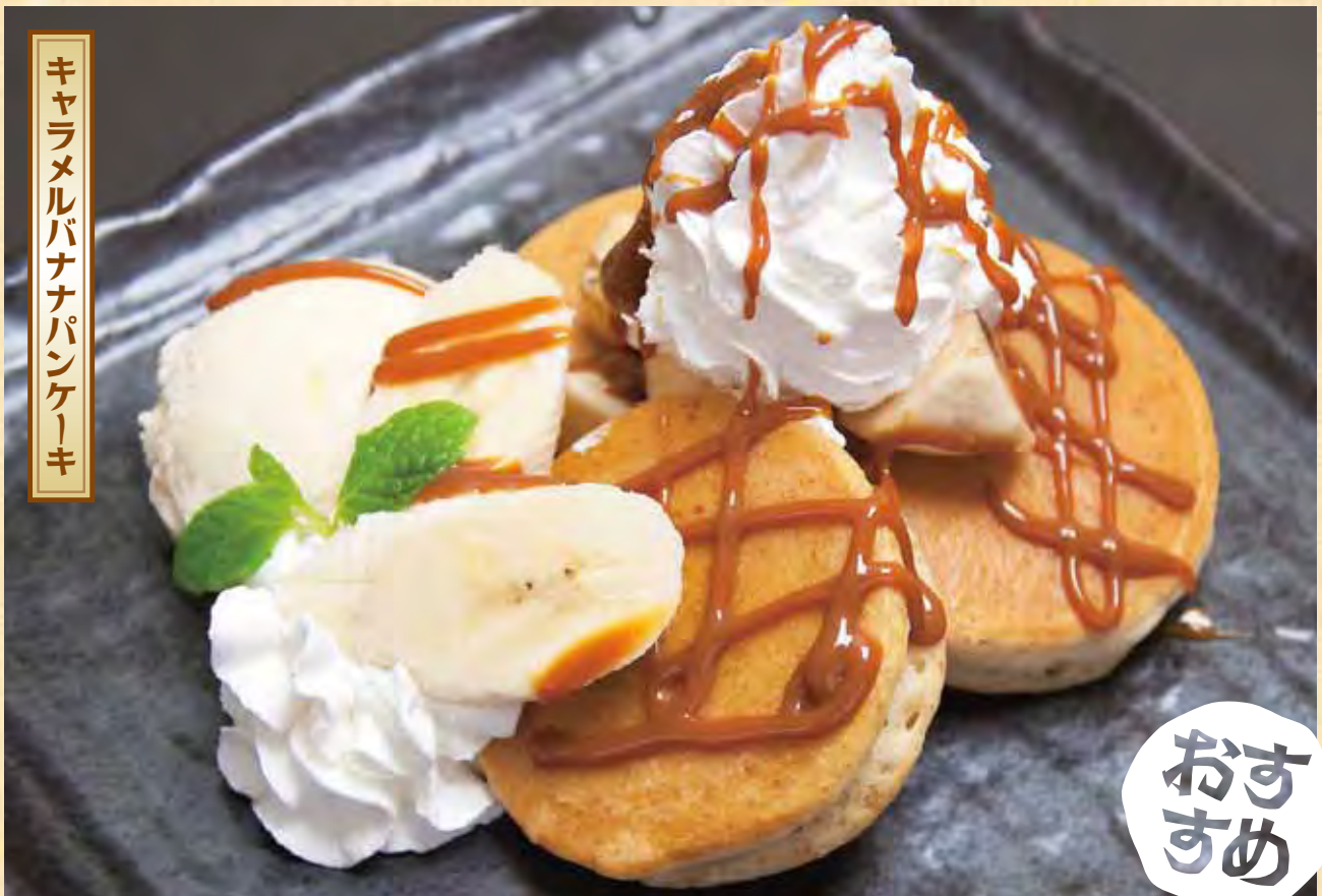
キャラメルバナナパンケーキ