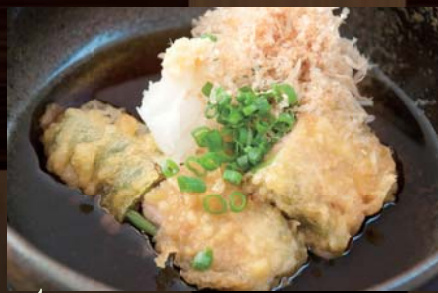
肉詰めピーマン揚げ出し 490円 (税込515円) 定番の肉詰めピーマンを揚げだしに！あっさりとした出汁が良く染みこんでいます。