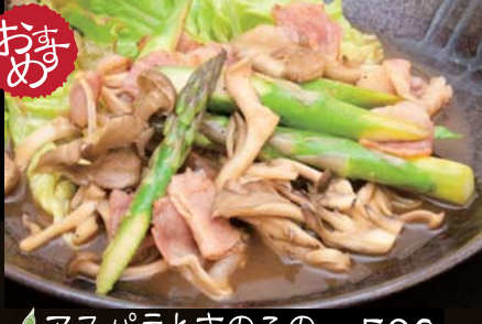
アスパラときのこのバターポン酢 590円 (税込620円) 旬のアスパラを定番のバター焼きにしました。ポン酢がまるやかさを引き立てています。