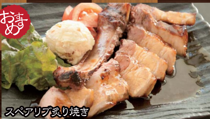
スペアリブ炙り焼き 960円 (税込1008円) 柔らかな骨付きスペアリブを豪快に焼き上げました。