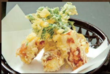
チーズとタラの芽が入ったちくわ天 590円 (税込620円) タラの芽とチーズ、ちくわを一つにまとめて天ぷらにしました。