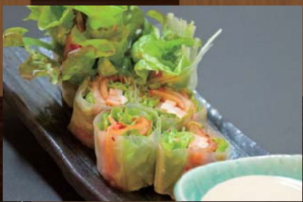
キムチとチャーシューの生春巻き 560円 (税込588円) キムチの辛味と酸味にチャーシューの旨味がマッチした一品です。