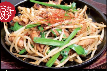
辛味噌ホルモン炒め 590円 (税込620円) 居酒屋の定番メニュー！ビールが良く合います！