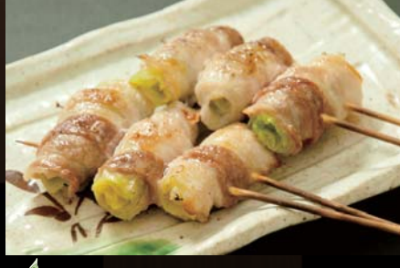
春キャベツの豚巻き串 399円 (税込419円) 旬のキャベツは甘いです。豚肉との相性はバツグンです！