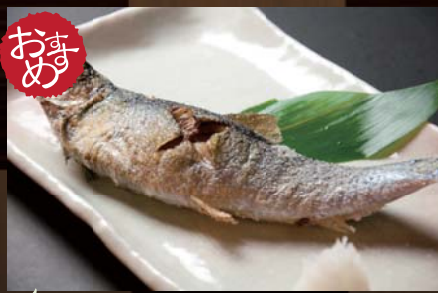
春ニシンの塩焼き 690円 (税込725円) まさしく旬魚、春ニシン。シンプルに塩焼きで魚本来の美味しさを！！