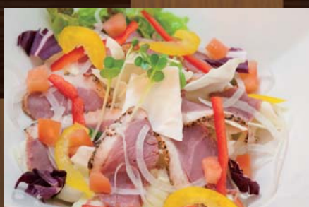
鴨スモークと春キャベツのサラダ 590円 (税込620円) 旬を迎えた春キャベツと、ピリッと胡椒がきいた鴨肉をサラダにしました。