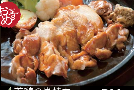
若鶏の炭焼き旨辛ソース 590円 (税込620円) じっくり焼き上げた鶏肉を、特製タレで味付けしました。