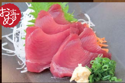
カツオの刺身 650円 (税込683円) 春のカツオは身が締まりあっさりとした脂のりのでいくら食べても飽きません。