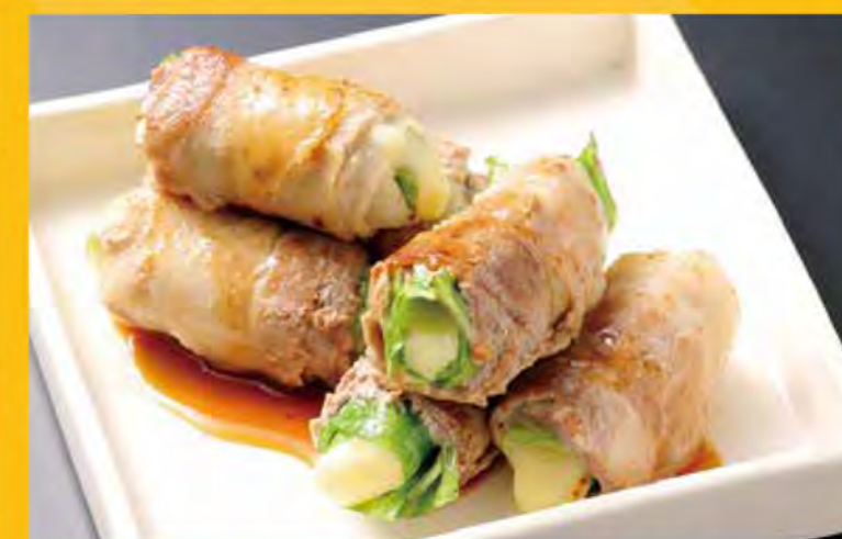
十勝豚肉のレタス巻き とろとろチーズ 658円 (税込711円)