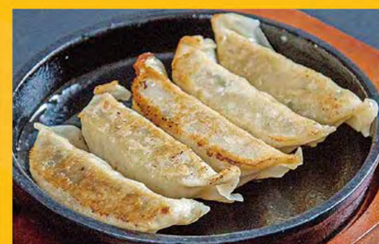
焼き餃子(5個) 498円 (税込538円)