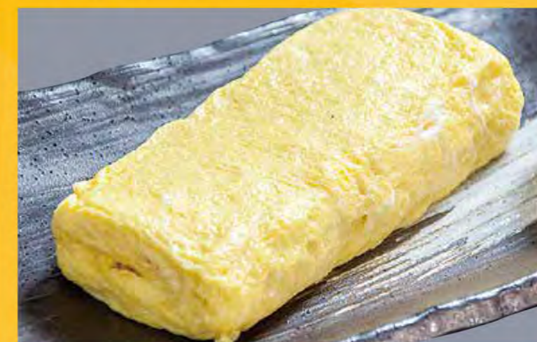
玉子焼き 499円 (税込539円)