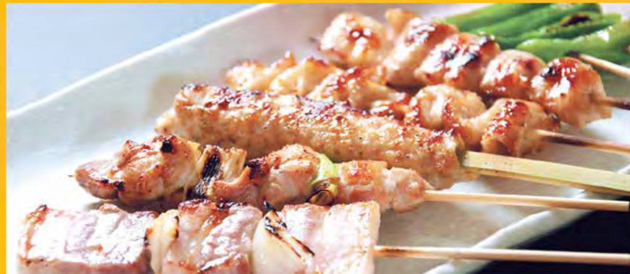
やきとん・鶏串 1本から