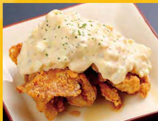
中札内田舎どりのタルタル 548円 (税込592円)