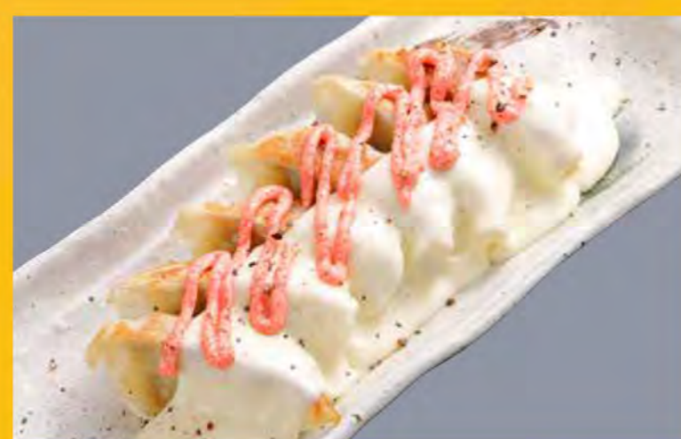
明太チーズ餃子(6個) 638円 (税込690円)