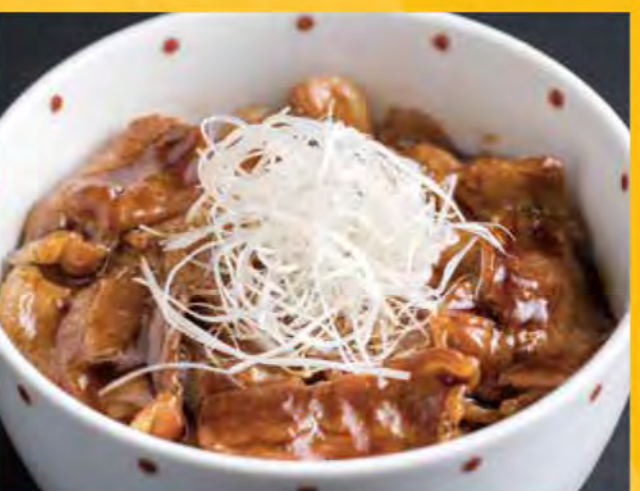
十勝豚丼 678円 (税込733円)