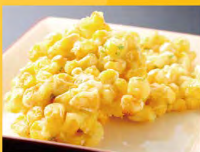
とよきび天婦羅 458円 (税込495円)