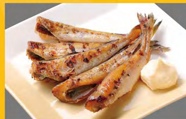
かんがい一夜干し 558円 (税込603円)