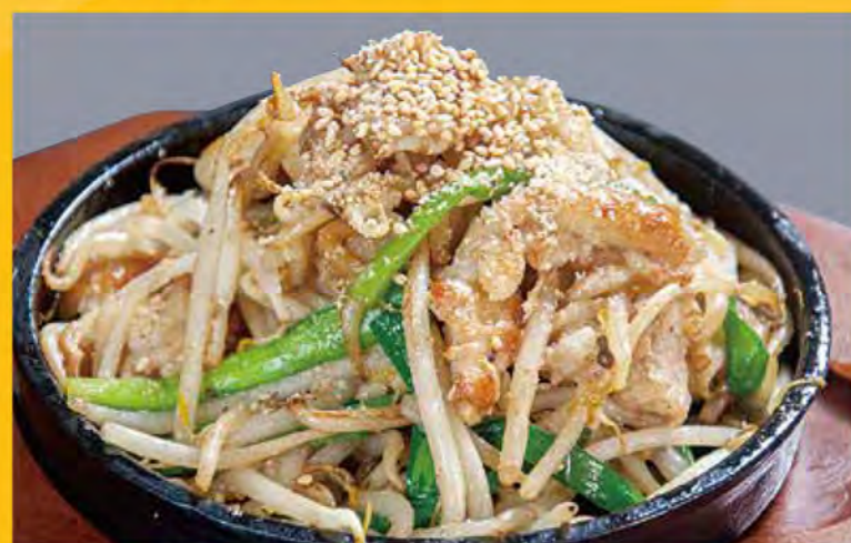
塩ホルモン炒め 528円 (税込571円)