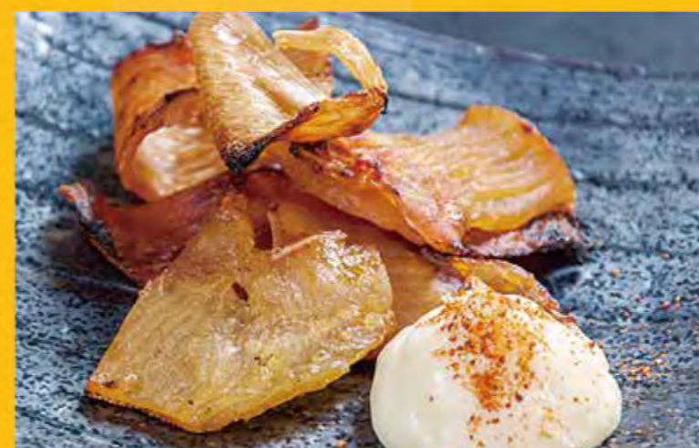
えいひれ 538円 (税込582円)