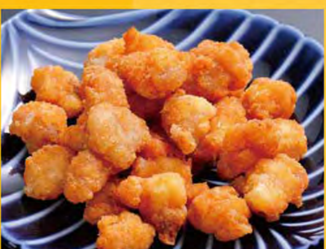
ナンコツから揚げ 528円 (税込571円)