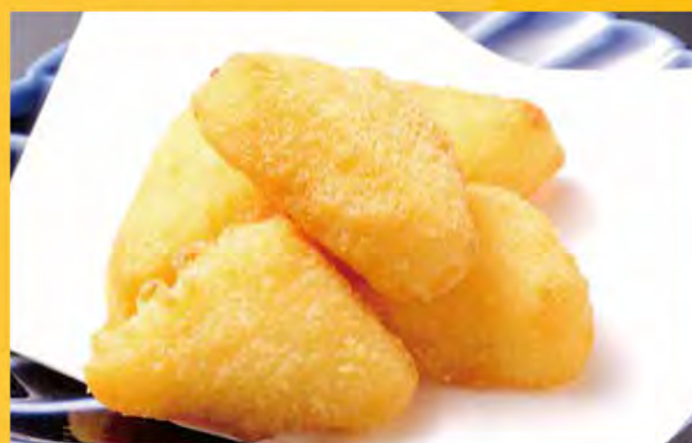
一口カマンベールフライ 528円 (税込571円)