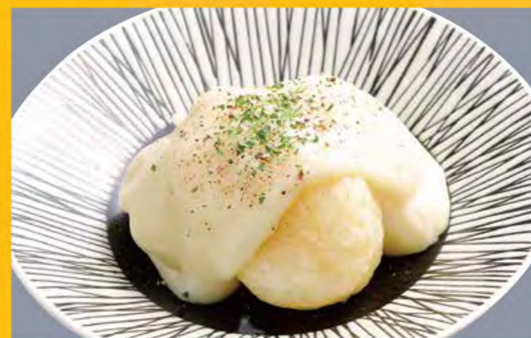
チーズいももち 499円 (税込539円)