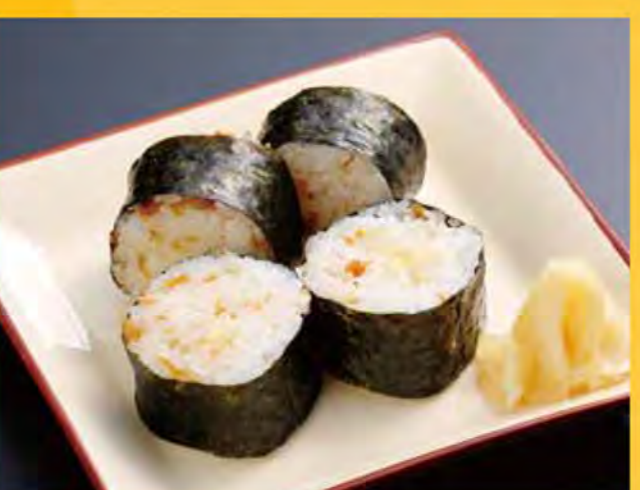
山わさび巻き 399円 (税込431円)