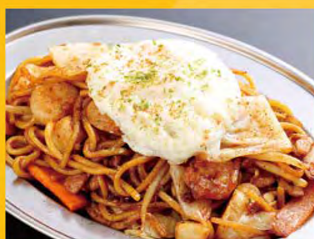
極太焼きそば 658円 (税込711円)