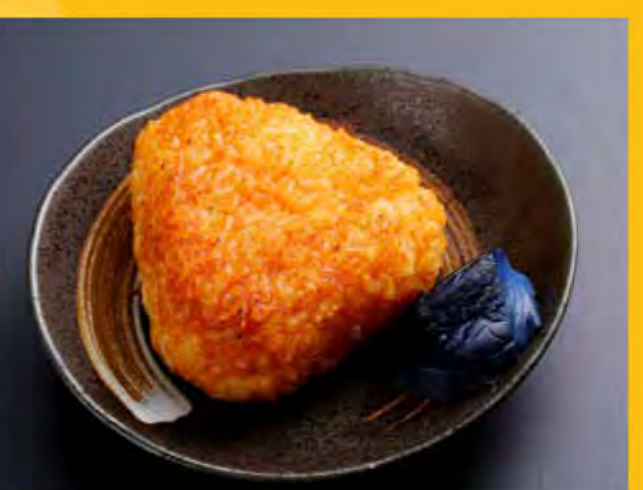
焼きおにぎり 270円 (税込292円)