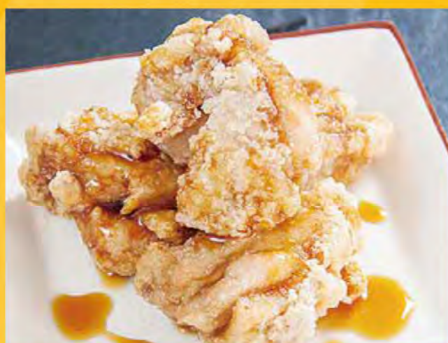
とととのタレザンギ 538円 (税込582円)