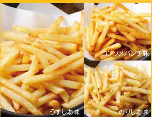
カルビーポテトフライ 各499円 (税込539円)