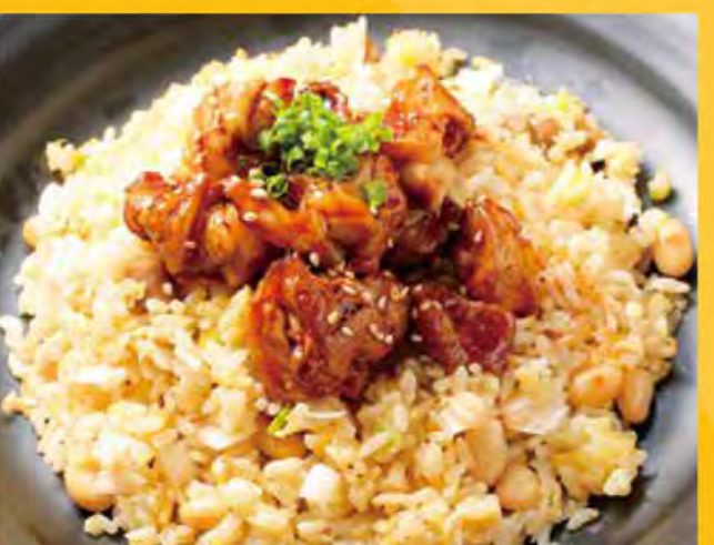
焼鳥炒飯 648円 (税込700円)