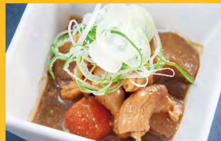
もつ煮込み 558円 (税込603円)