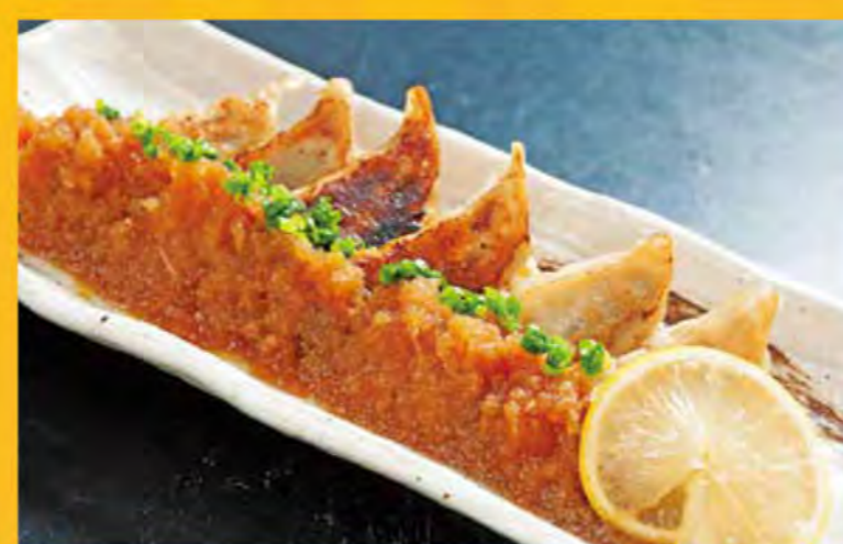
やみつき餃子 レモンおろし酢餃子(6個) 516円 (税込558円)