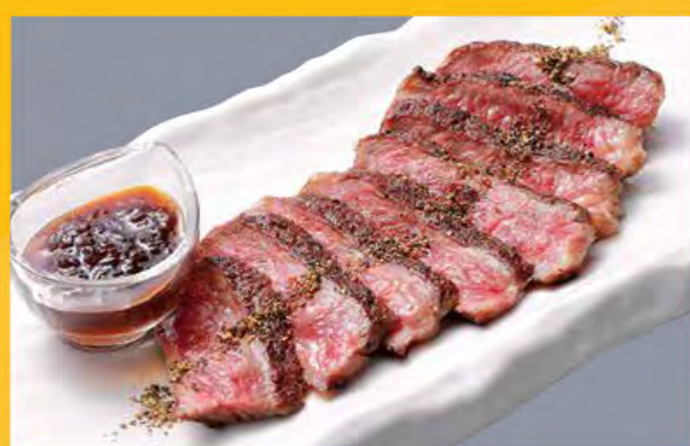
十勝ハラブステーキ 1,980円 (税込2,139円)