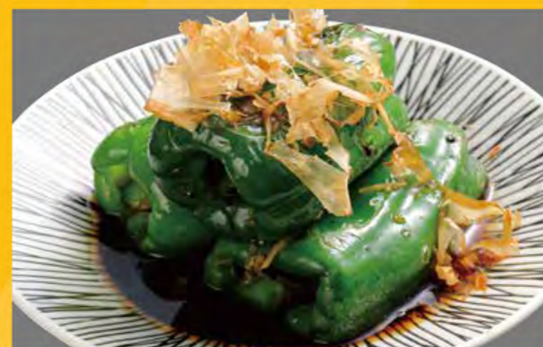
無限焼きピーマン 478円 (税込517円)