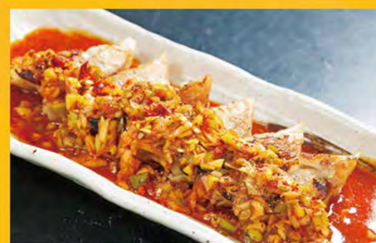
やみつき餃子 ピリ辛葱餃子(6個) 568円 (税込614円)