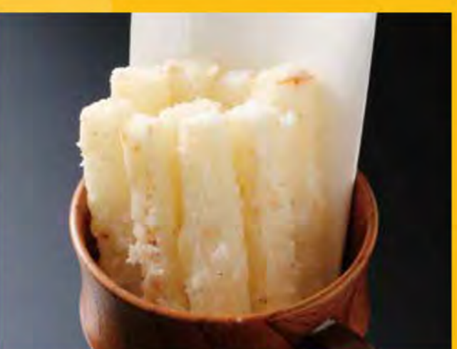
長芋フライ 499円 (税込539円)