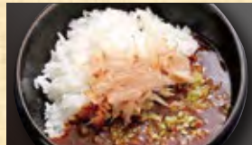
メのカレー 450円 (税込486円)