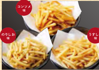
北海道産じゃが芋 カルビーポテトフライ (コンソメ・うすしお・のりしお) 各528円 (税込571円)