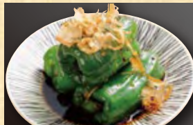
無限焼きピーマン 478円 (税込517円)