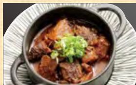
牛すじのどて焼き 658円 (税込711円)