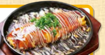
焼きなでとんぺい焼きレギュラー 569円 (税込615円)