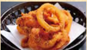
イカから揚げ 518円 (税込560円)