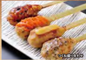
つくね盛り合わせ