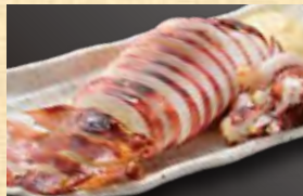
いか丸焼き ハーフ 890円 (税込962円) 590円 (税込638円)