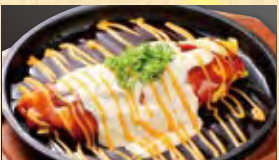
焼きなて!とんべい焼き チーズタルタル 612円 (税込661円)