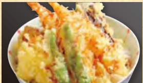
天ぷらめし 三代目真之コラボレーション 天丼 798円 (税込862円)