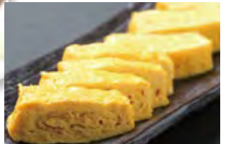
出汁巻き玉子 568円 (税込614円)