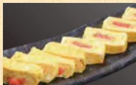
明太出汁巻き玉子 629円 (税込680円)