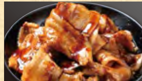
肉盛り豚丼 698円 (税込754円)