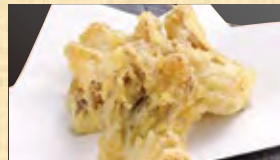
舞茸天 399円 (税込431円)