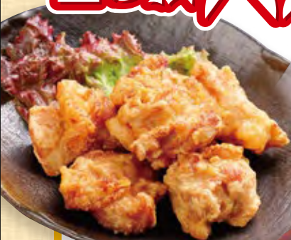
北海道ザンギ (6個) 628円 (税込679円)