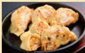
北海道「平田牧場」三元豚ジャンボ餃子 キムチ 718円 (税込776円)