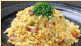
黄金チャーシュー炒飯 698円 (税込754円)