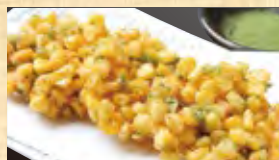
十勝のとうきびかき揚げ 568円 (税込614円)