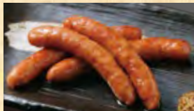
千歳「肉の山本」ラムソーセージ 炙り焼き 799円 (税込863円)