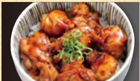
焼鳥丼 590円 (税込638円)