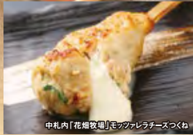
中札内「花畑牧場」モツツアレチーズつくね