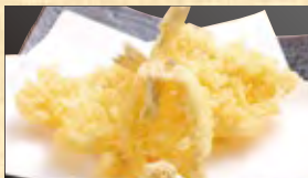
鱧天 568円 (税込614円)