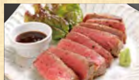
牛フィレステーキ 1,699円 (税込1,835円)