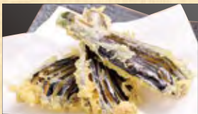
茄子天 399円 (税込431円)