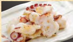
炙りタコ 688円 (税込744円)