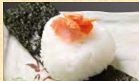
おにぎり 鮭 228円 (税込247円)