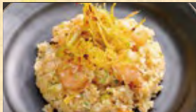
辣油とネギ油の海老炒飯 728円 (税込787円)