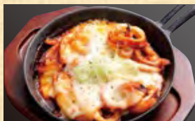
イカとキムチのチーズ焼き 850円 (税込918円)