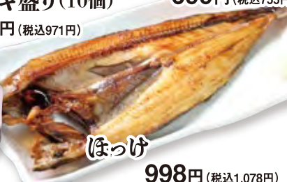
ほっけ 998円 (税込1,078円) ハーフ 589円 (税込637円)