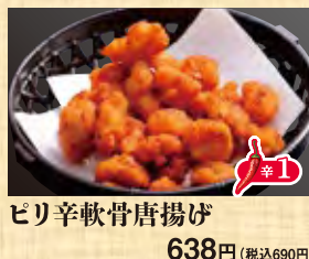
ピリ辛軟骨唐揚げ 638円 (税込690円)