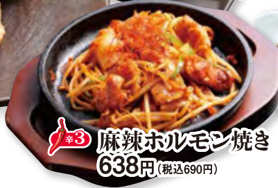
麻辣ホルモン焼き 638円 (税込690円)