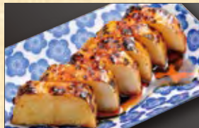
長芋炙り 柚子胡椒タレ 558円 (税込603円)