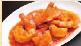
あんかけ焼きそば 889円 (税込961円)