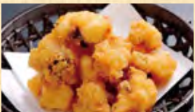
タコザンギ 568円 (税込614円)