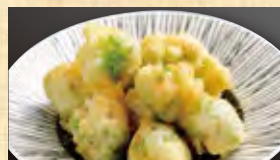
ロマネスコから揚げ 490円 (税込530円)