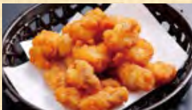
軟骨から揚げ 599円 (税込647円)