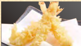
大海老天 668円 (税込722円)