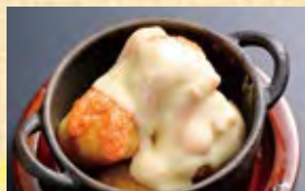
明太じゃがチーズ焼き 528円 (税込571円)