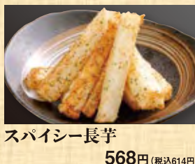
スパイシー長芋 568円 (税込614円)