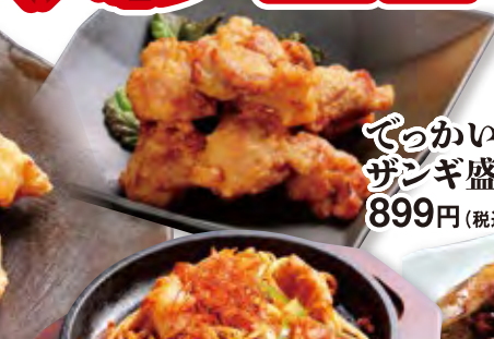
でっかいどろザンギ盛り(10個) 899円 (税込971円)