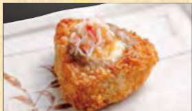
カニ味噌チーズ焼きおにぎり 430円 (税込465円)