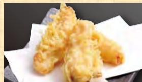
かしわ天 399円 (税込431円)