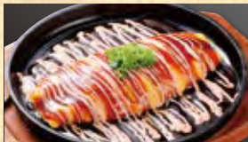
焼きなて!とんべい焼き 明太マヨ 599円 (税込647円)