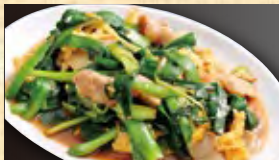
海老のチリソース 890円 (税込962円)