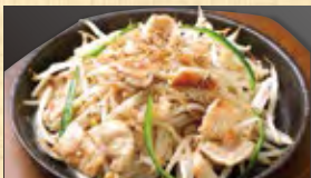
名物!塩ホルモン焼き 599円 (税込647円)