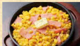
十勝とうきびバター醤油 438円 (税込474円)