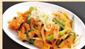
豚キムチ炒め 658円 (税込711円)