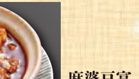
肉ニラ炒め 638円 (税込690円)