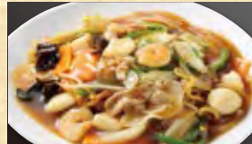
辛味あんかけ焼きそば 899円 (税込971円)