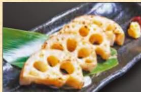
レンコン炙り焼き 638円 (税込690円)