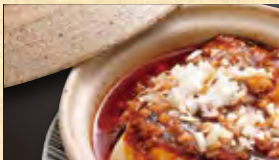
麻婆豆腐 980円 (税込1,059円)