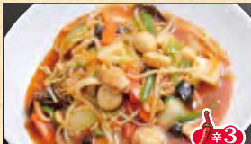
辛味あんかけ焼きそば 899円 (税込971円)