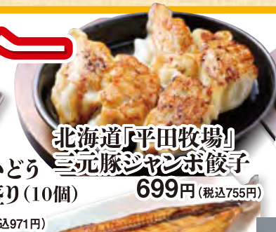
北海道「平田牧場」三元豚ジャンボ餃子 699円 (税込755円)