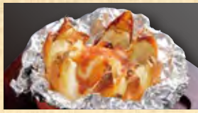
新篠津 つちから農場 特別栽培 丸ごと玉ねぎ炙り焼き ニンニク味噌 498円 (税込538円)