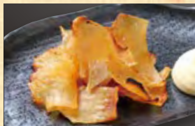
エイヒレ炙り 628円 (税込679円)