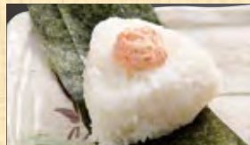
おにぎり 明太マヨチーズ 268円 (税込290円)