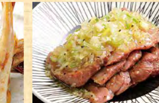
牛タン葱まみれ 1280円 (税込1383円)