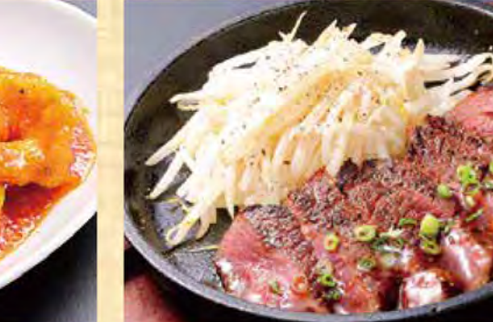
サガリ鉄板焼き 899円 (税込971円)