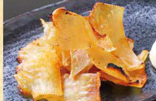
エイヒレ炙り焼き 599円 (税込647円)