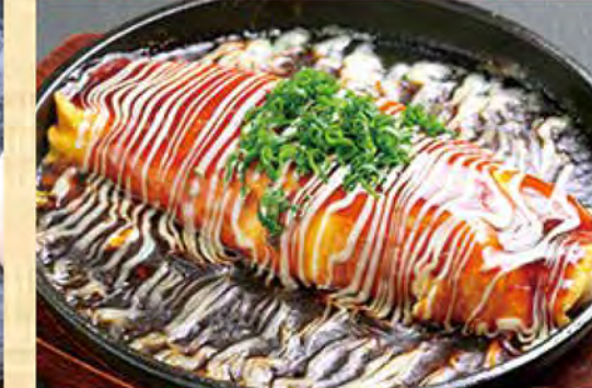
とんぺい焼き レギュラー 569円 (税込615円)