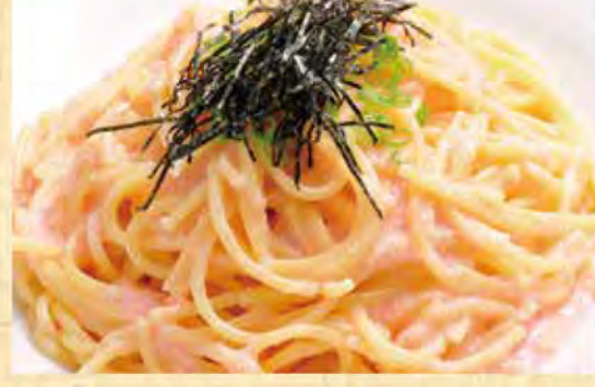
たらこパスタ 728円 (税込787円)