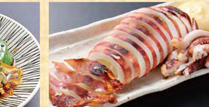
イカの丸ごと焼き 1090円 (税込1178円)