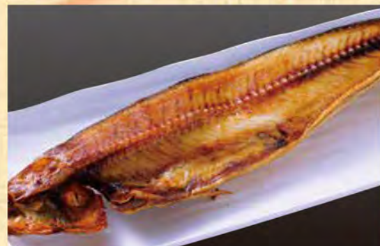
ほっけ ハーフ 589円 (税込637円)