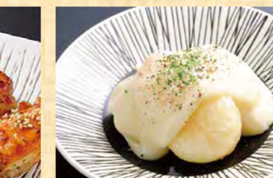
チーズいももち 490円 (税込530円)