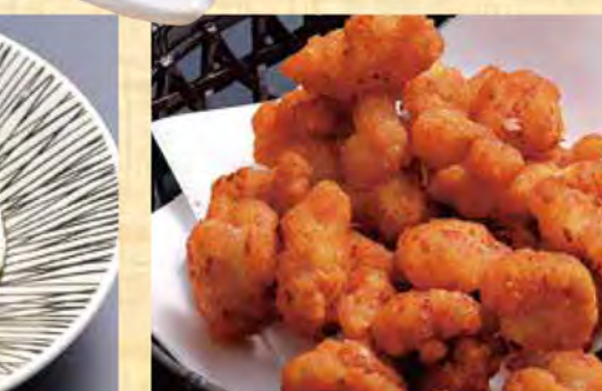
ピリ辛鶏軟骨の唐揚げ 629円 (税込680円)