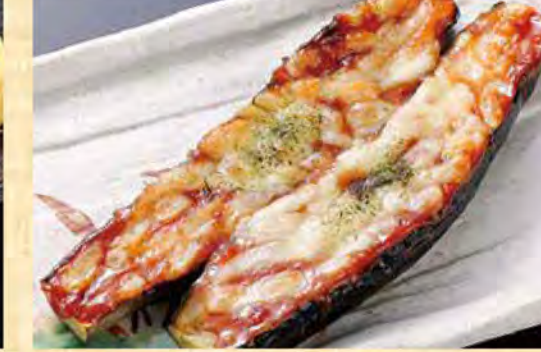
茄子味噌チーズ焼き 568円 (税込614円)