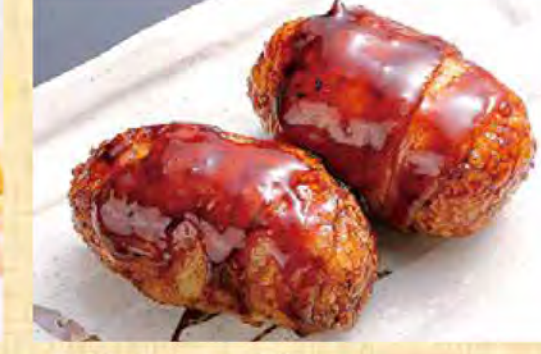
肉巻きおにぎり 488円 (税込528円)