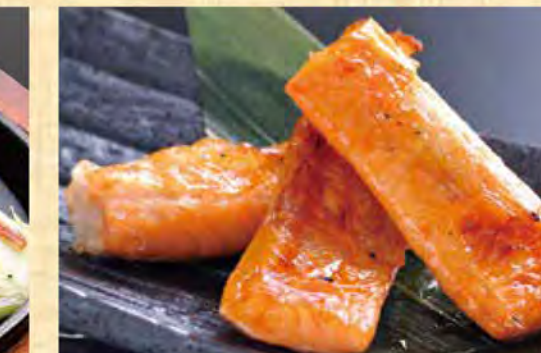
サーモンハラス焼き 698円 (税込754円)