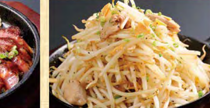
大盛りブラックペッパー もやし炒め 499円 (税込539円)