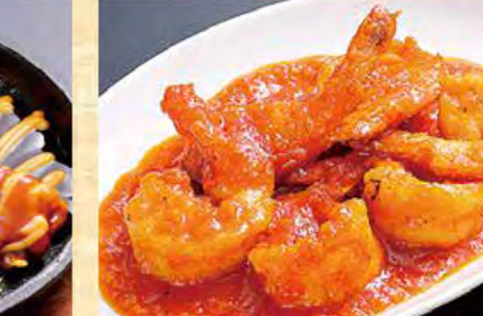
海老のチリソース 899円 (税込971円)