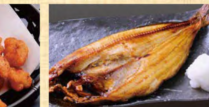
ほっけ 998円 (税込1078円)