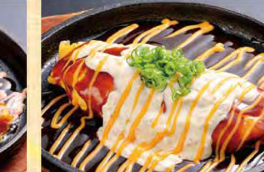
とんぺい焼き チーズタルタル 599円 (税込647円)