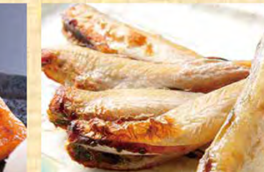
かんかい一夜干し(コマイ) 558円 (税込603円)