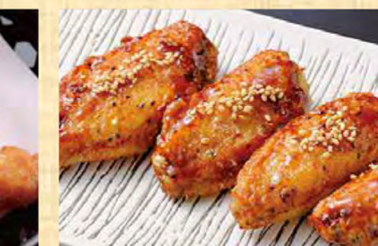
手羽先揚げ(4本) 499円 (税込539円)