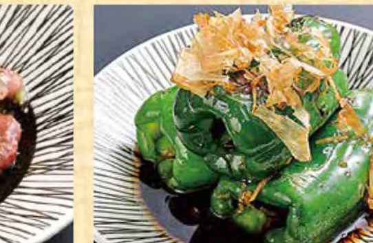
無限焼きピーマン 478円 (税込517円)