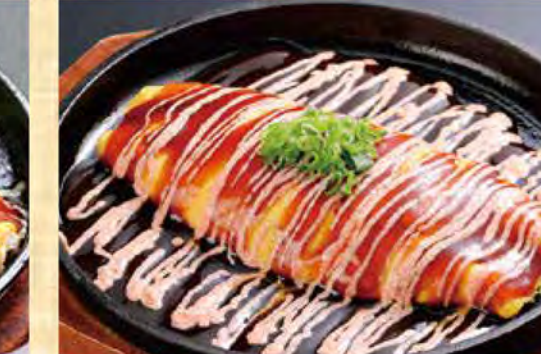
とんぺい焼き 明太マヨ 589円 (税込637円)