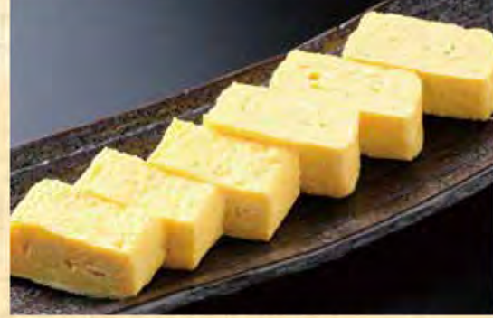
鶏スープのだし巻き玉子 568円 (税込614円)