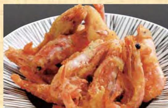
小エビのから揚げ 499円 (税込539円)