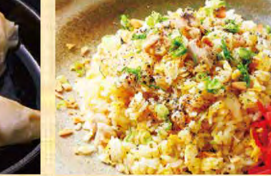
焦がしニンニク炒飯 738円 (税込798円)