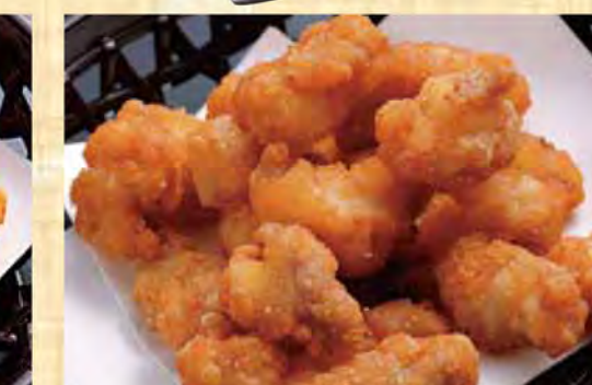
鶏軟骨の唐揚げ 599円 (税込647円)