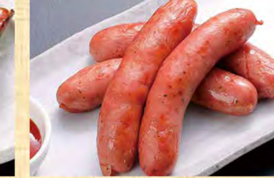
ラムソーセージ炙り 699円 (税込755円)