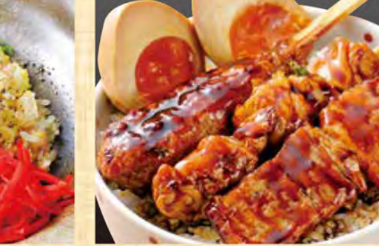
焼鳥親子丼 728円 (税込787円)