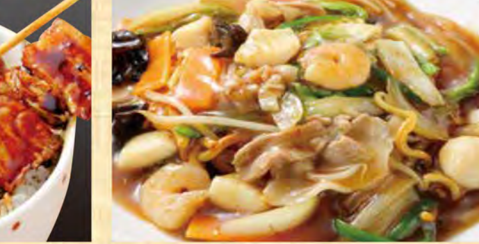
あんかけ焼きそば 899円 (税込971円)