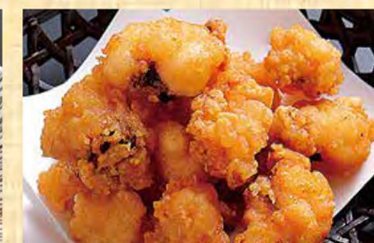
タコの唐揚げ 568円 (税込614円)