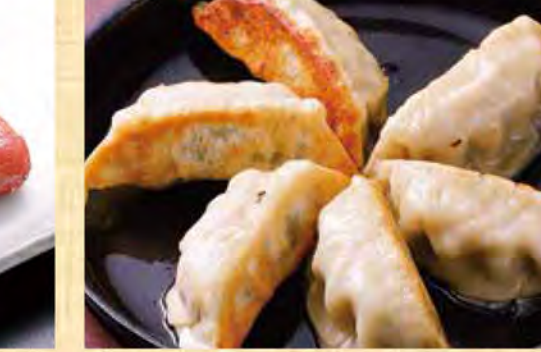
餃子(6個) 598円 (税込646円)