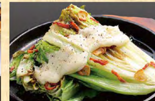
ロメインレタスの炙り焼き チーズソース 790円 (税込854円)