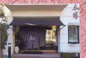
紺色ののれんが目玉の観光地「瑞鳳殿」のほど近くにある

森の香本舗 もりのかほんぽ 仙台市青葉区大手町5-5 ☎022-223-1314 営業時間: 9:30~18:30 毎月第2・4日曜 回1台 送料302円~ 不可 宮地鉄東西線大町西公園駅より徒歩4分