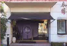
紺色ののれんが目玉を引く外観。観光地「瑞鳳殿」のほど近くにある