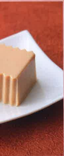
となめらかな舌触りが魅力の「口の「日韓ワールドカップ」のお茶