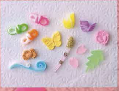
繊細かつかわいらしい干菓子は76円から。つくしや蝶、サワガニなど登場するものは季節によってさまざま

森の香本舗 もりのかほんぽ 仙台市青葉区大手町5-5 ☎022-223-1314 営業時間: 9:30~18:30 毎月第2・4日曜 回1台 送料302円~ 不可 宮地鉄東西線大町西公園駅より徒歩4分