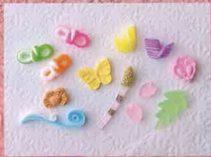
繊細かつかわいらしい干菓子や和菓子は76円から。つくしや蝶、サワガニなど登場するものは季節によってさまざま

森の香本舗 仙台市青葉区大手町5-5 ☎022-223-1314 営業時間 9:30~18:30 毎月第2・4日曜 同1台 送料302円~ 不可 駅地下鉄東西線大町西公園駅より徒歩4分