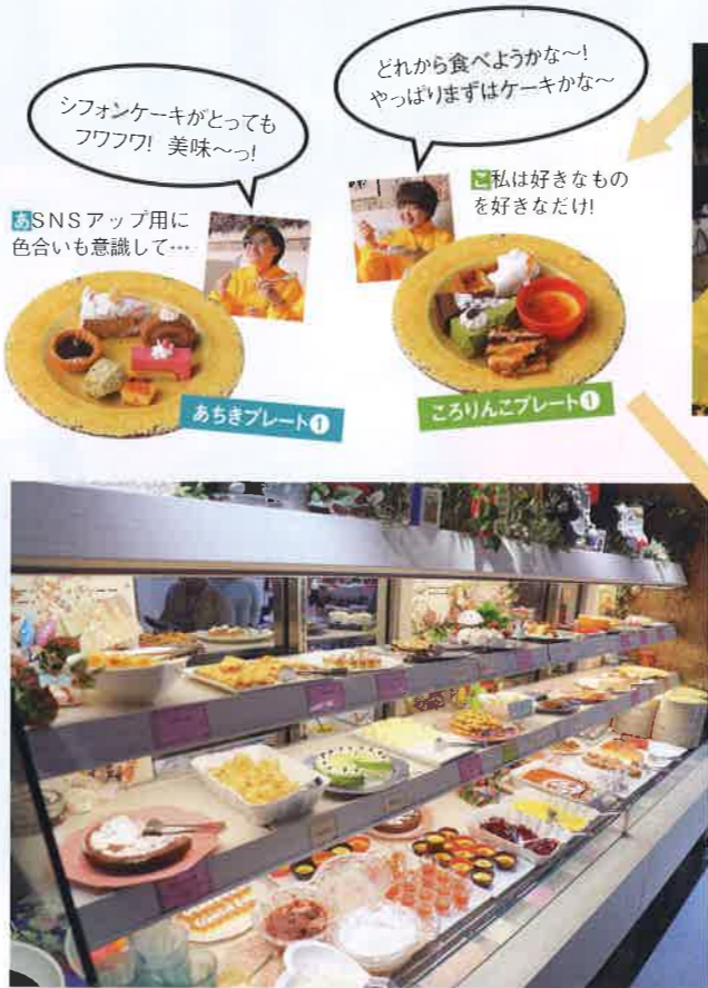
50種類以上のケーキが並ぶショーケース。和テイストなスイーツ、王道のショートケーキ、クリームブリュレ、うーん…どれにしようかな(悩)

「不思議の国のアリス」の世界観の中でスイーツを楽しめるビュッフェスタイルのお店が昨年12月『仙台 FORUS』にオープンした。50種類以上のケーキが並ぶショーケースに、彩り豊かなアイスクリームやパフェ。今、巷の女子たちに話題の店『& sweets! sweets! buffet! Alice』に編集部あちきところりんこが潜入してきました!