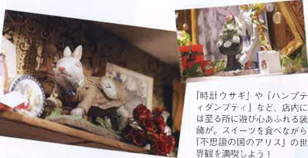
「時計ウサギ」や「ハンプティダンブティ」など、店内には至る所に遊び心あふれる装飾が。スイーツを食べながら、「不思議の国のアリス」の世界観を満喫しよう!

まとめ ● Aliceの魅力は、まず空間の可愛らしさ! お店の外壁や、ビュッフェ台、天井や壁など…。細部までこだわった作りなので、まるでおとぎの国に迷い込んだような感覚になりますよ! ● MYパフェ作り、好きなものでチョコレートファウンテンもできたし、すっごく楽しかった! 12星座のフレーバーティーもおすすめてですよ。友だちや家族、カップルでワイワイ楽しんでくださいな。 ● みなさんも存分に堪能してください! それにしても…お腹いっぱい!