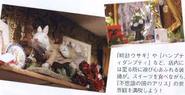
「時計ウサギ」や「ハンプティダンブティ」など、店内には至る所に遊び心あふれる装飾が。スイーツを食べながら、「不思議の国のアリス」の世界観を満喫しよう!

まとめ 『Alice』の魅力は、まず空間の可愛らしさ! お店の外壁や、ビュッフェ台、天井や壁など... 細部までこだわった作りなので、まるでおとぎの国に迷い込んだような感覚になりますよ! MYパフェ作り、好きなものでチョコレートファウンテンもできたり、すっごく楽しかった! 12星座のフレーバーティーもおすすめてですよ。友だちや家族、カップルでワイワイ楽しんでくださいな。 みなさんも存分に堪能してください! それにしても... お腹いっぱい!