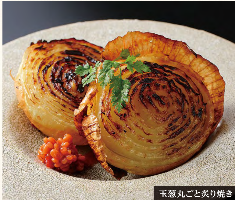
玉葱丸ごと炙り焼き