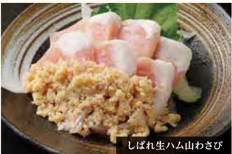
しばれ生ハム山わさび