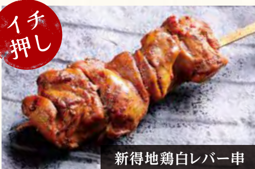
新得地鶏白レバー串