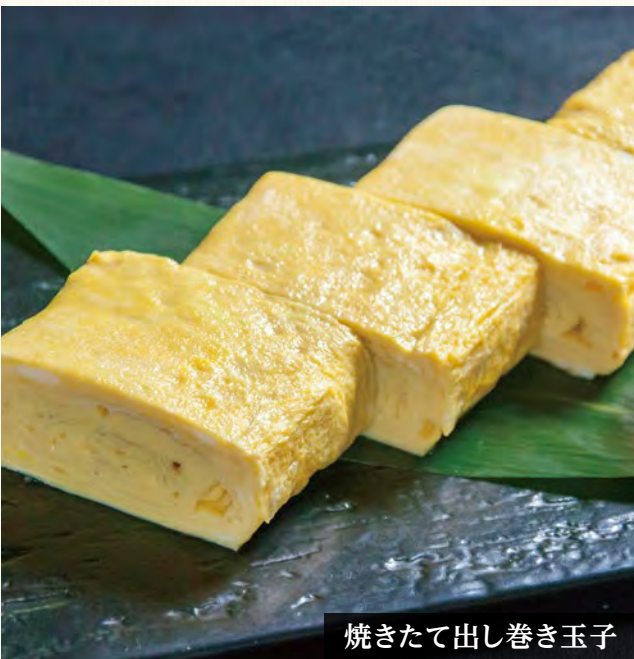
焼きたて出し巻き玉子