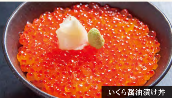
いくら醤油漬け丼