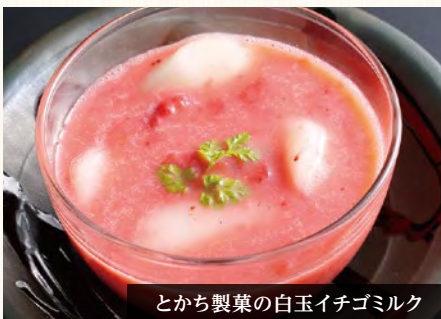
とち製菓の白玉イチゴミルク