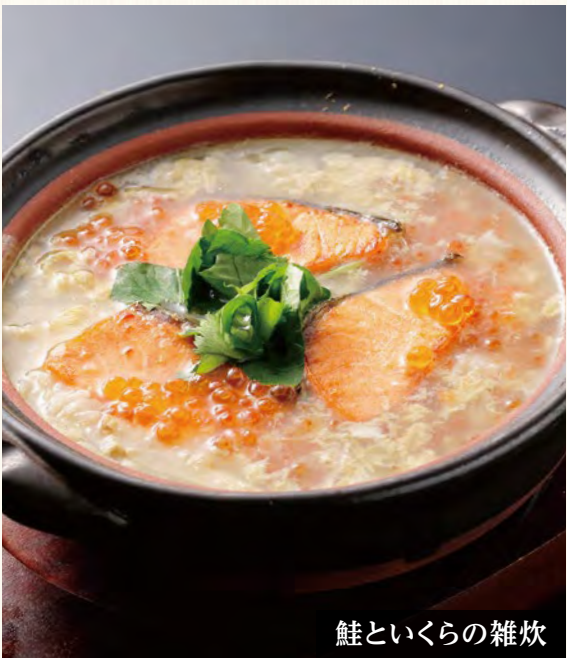
鮭といくらの雑炊