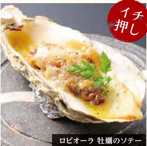
ロビオーラ 牡蠣のソテー