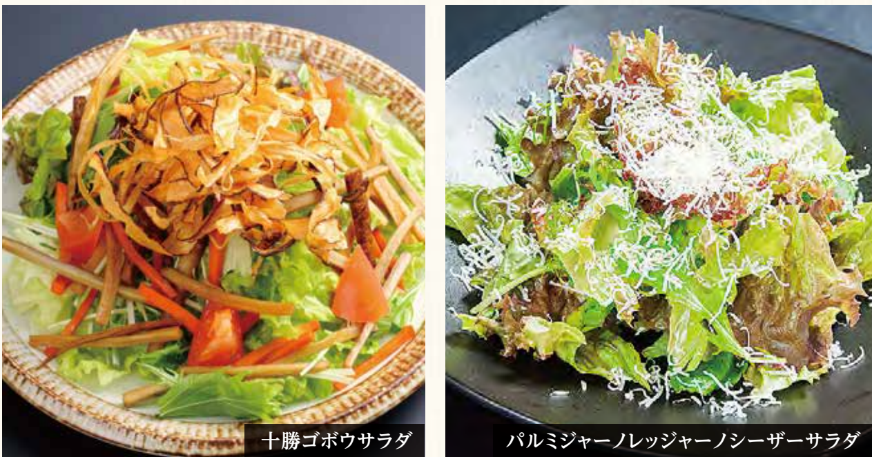
十勝ゴボウサラダ