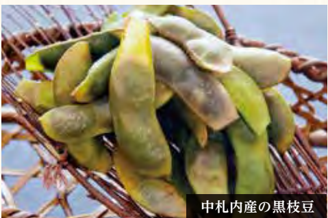
中札内産の黒枝豆