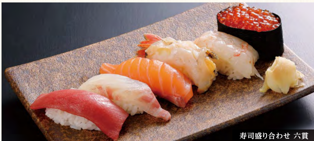
寿司盛り合わせ 六貫