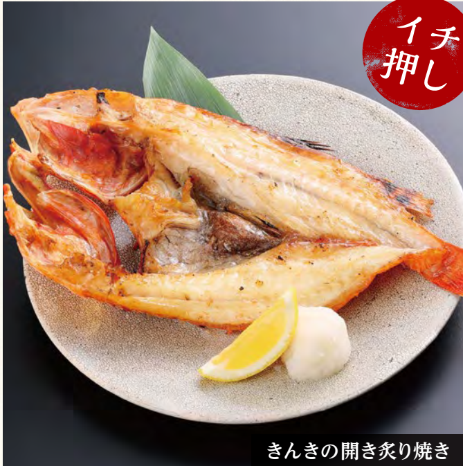
きんきの開き炙り焼き