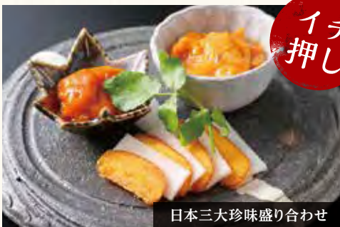
日本三大珍味盛り合わせ