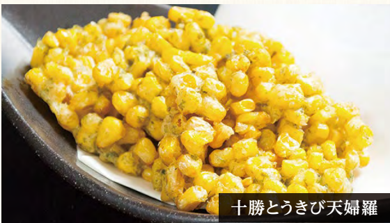
十勝とうきび天婦羅