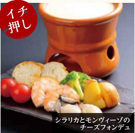
シラリカとモンヴィーゾのチーズフォンデュ