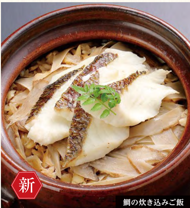
鯛の炊き込みご飯