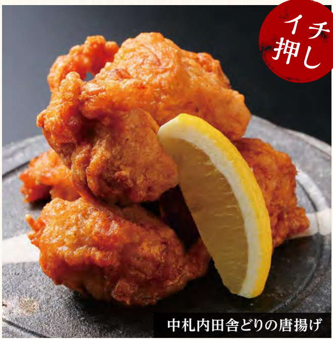
中札内田舎どりの唐揚げ