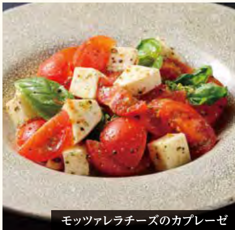
モッツアレラチーズのカプレーゼ