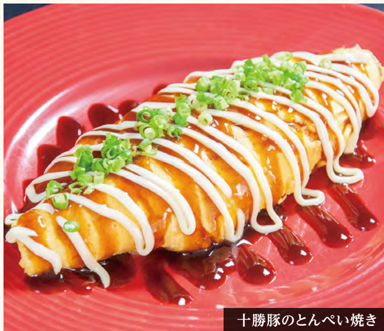
十勝豚のとんぺい焼き