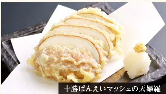
十勝ばんえいマッシュの天婦羅