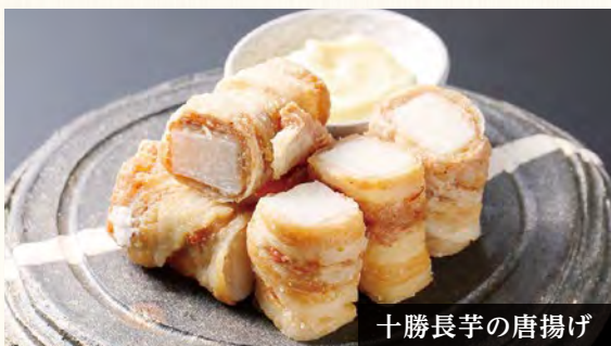
十勝長芋の唐揚げ