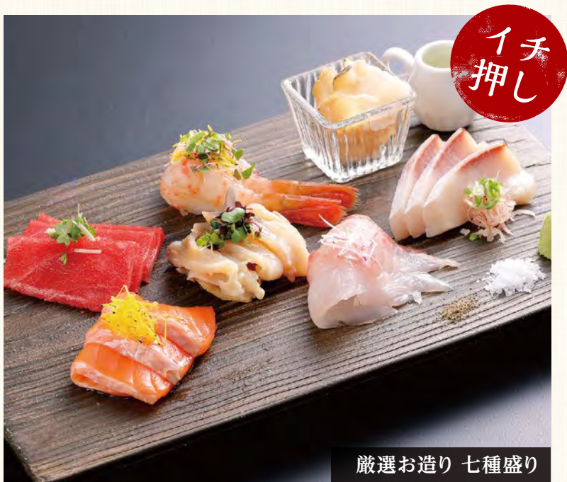
厳選お造り 七種盛り