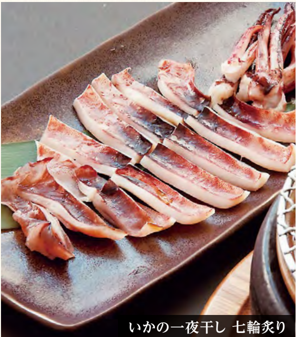
いかの一夜干し 七輪炙り