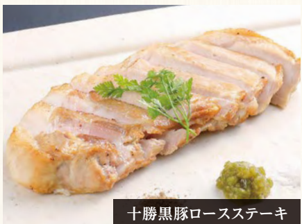
十勝黒豚ロースステーキ