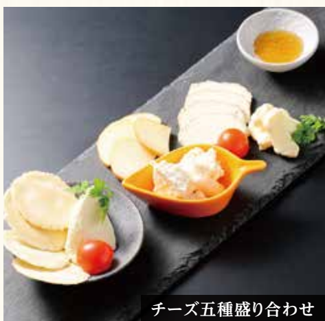
チーズ五種盛り合わせ