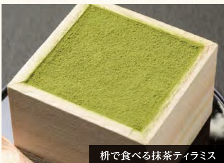
枡で食べる抹茶ティラミス