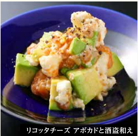
リコッタチーズ アボカドと酒盗和え