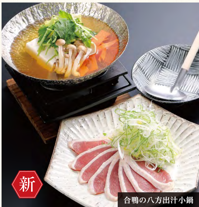
合鴨の八方出汁小鍋