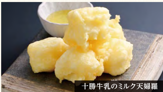
十勝牛乳のミルク天婦羅