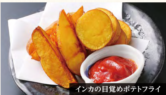
インカの目覚めポテトフライ