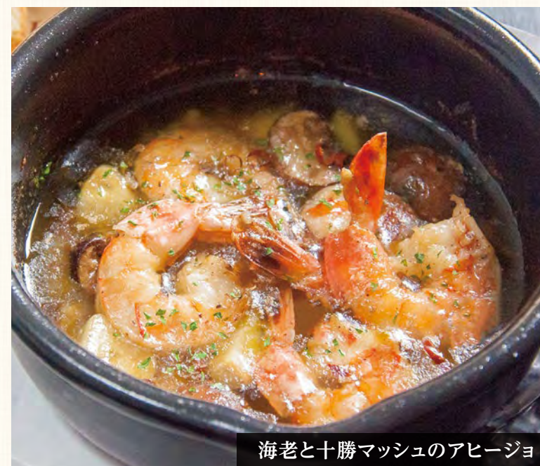
海老と十勝マッシュのアヒージョ