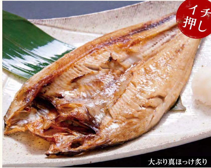
大ぶり真ほっけ炙り