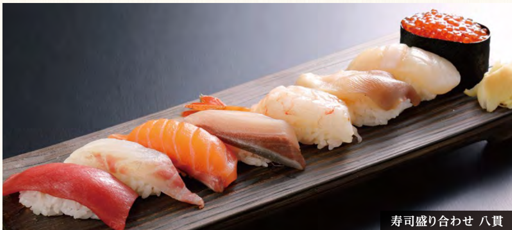
寿司盛り合わせ 八貫