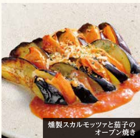
燻製スカルモッツァと茄子のオープン焼き