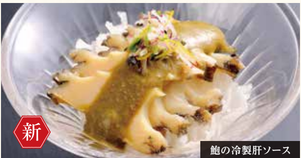
鮑の冷製肝ソース