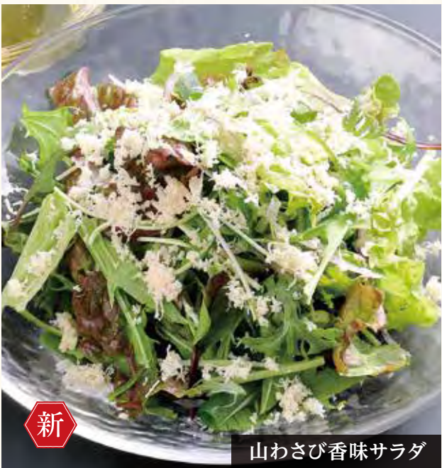
山わさび香味サラダ