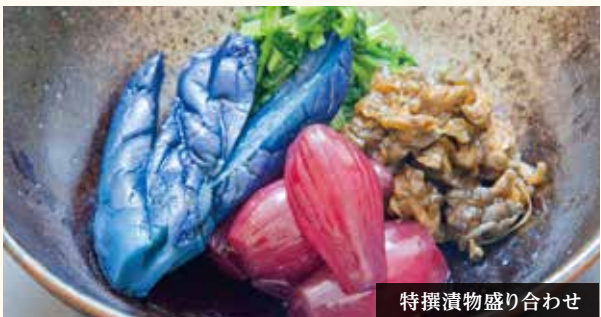
特撰漬物盛り合わせ