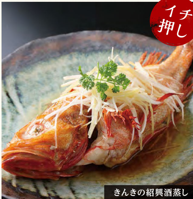
きんぎの紹興酒蒸し