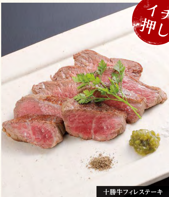
十勝牛フィレステーキ