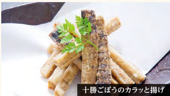
十勝ごぼうのカラッと揚げ