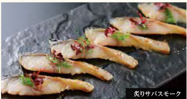
炙りサバスマーク