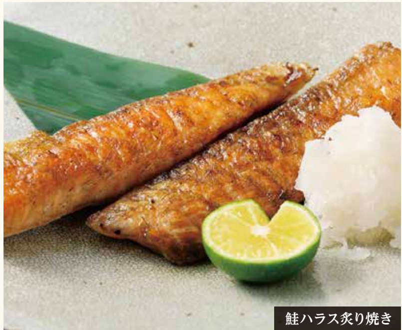
鮭ハラス炙り焼き