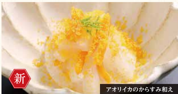
アオリイカのからすみ和え