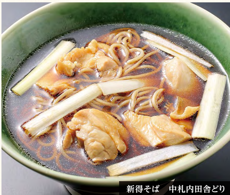
新得そば 中札内田舎どり