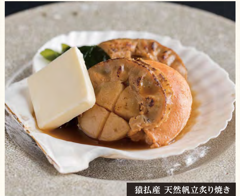
猿払産 天然帆立炙り焼き