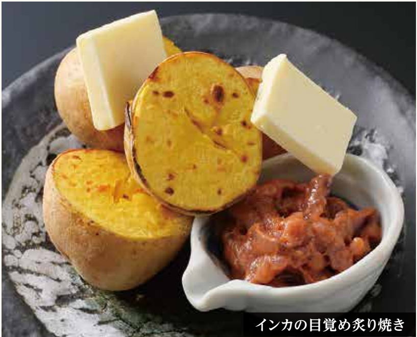
インカの目覚め炙り焼き