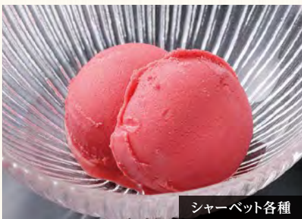
シャーベット各種