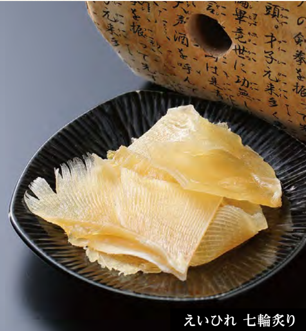
えいひれ 七輪炙り