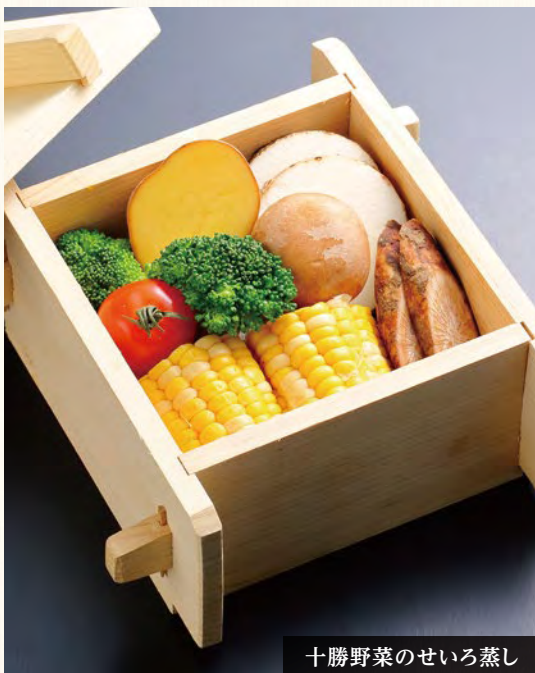
十勝野菜のせいろ蒸し