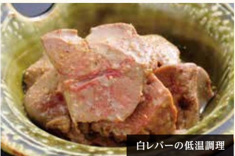
白レバーの低温調理