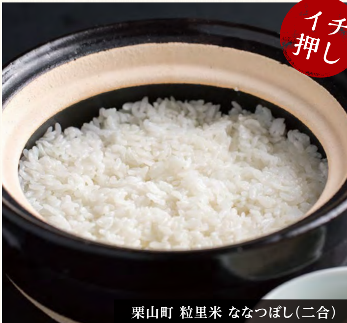
栗山町 粒里米 ななつぼし(二合)