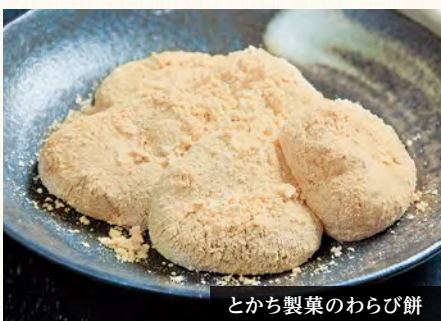
とち製菓のわらび餅