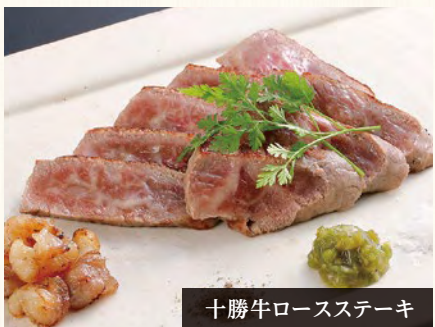
十勝牛ロースステーキ