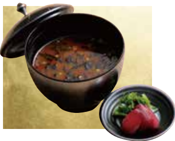
味噌汁・漬物セット