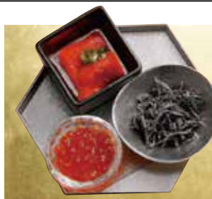
選べるご飯のお供