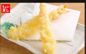
◆えび天 440円 (税込484円)