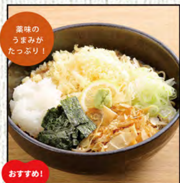
ちどりそば 754円 (税込830円)