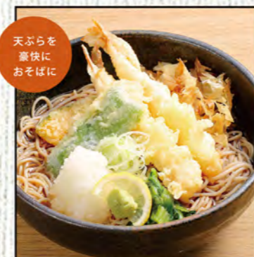
天おろしそば 900円 (税込990円)