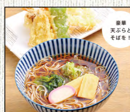
天ぷらそば 1,118円 (税込1,230円)