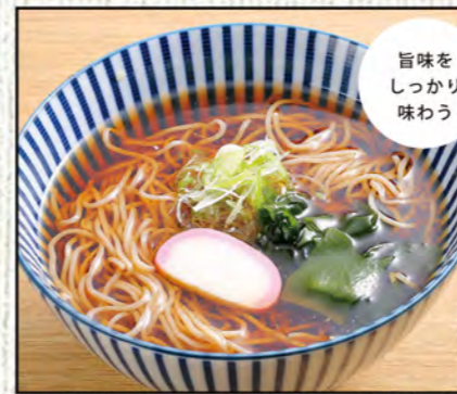
かけそば 590円 (税込649円)