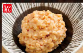
◆納豆 100円 (税込110円)