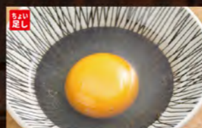
◆生玉子 68円 (税込75円)

北海道のそばと言えば、新得産のそば。 自然溢れる土地の中、朝晩の寒暖差の冷涼な気候が育てた、 風味豊かなそばです。 その土地を生かした味、新得のこだわりそばを使用。