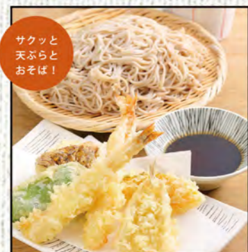
天ざるそば 1,118円 (税込1,230円)