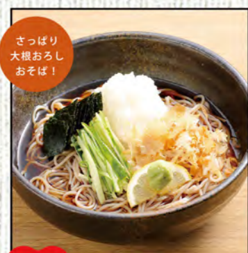
おろしそば 745円 (税込820円)