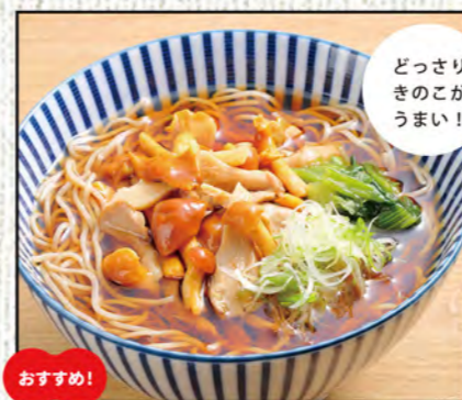
きのこそば 863円 (税込950円)