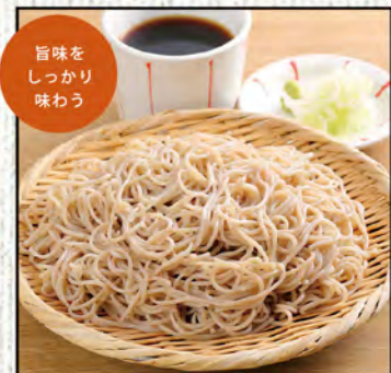
もりそば 545円 (税込600円) 大盛そば 636円 (税込700円)