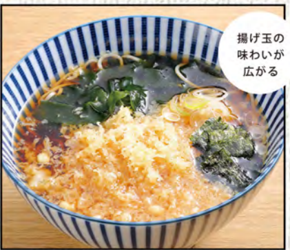
たまきそば 690円 (税込759円)