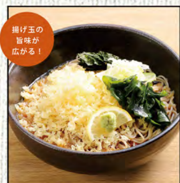
冷やしたまぬき 681円 (税込750円)