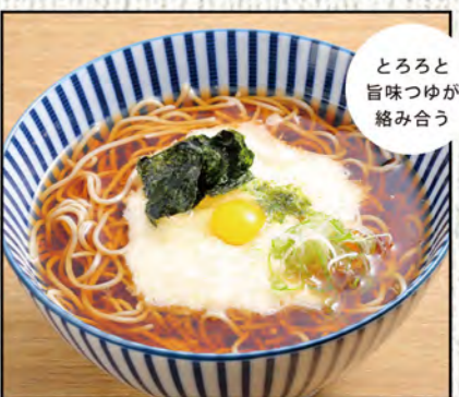
とろろそば 763円 (税込840円)