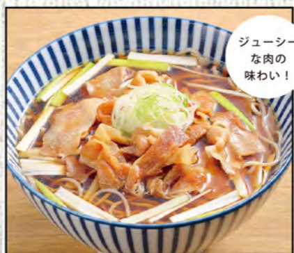
肉そば 890円 (税込979円)