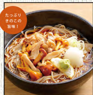
きのこそば 854円 (税込940円)