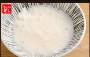
◆とろろ 200円 (税込220円)