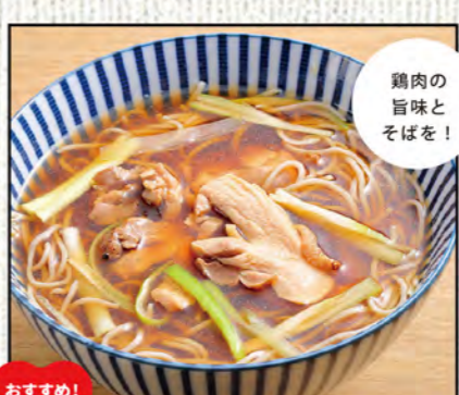
かしわそば 836円 (税込920円)