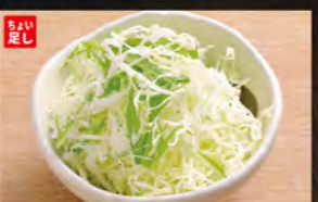
◆ミニサラダ 136円 (税込150円)