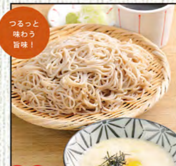
とろろざるそば 754円 (税込830円)