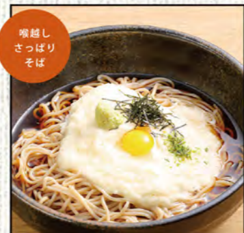
とろろそば 754円 (税込830円)