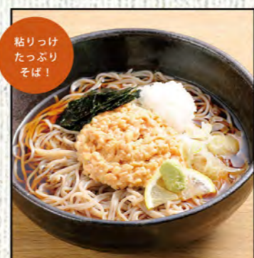
納豆そば 754円 (税込830円)