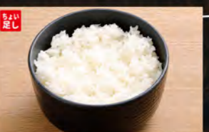
◆ごはん 200円 (税込220円)