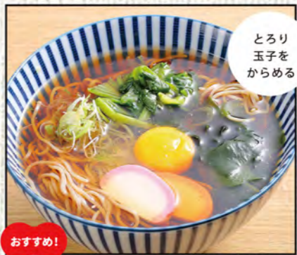
月見そば 681円 (税込750円)