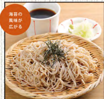
ざるそば 627円 (税込690円) 大盛ざるそば 727円 (税込800円)