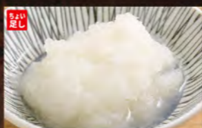
◆大根おろし 100円 (税込110円)