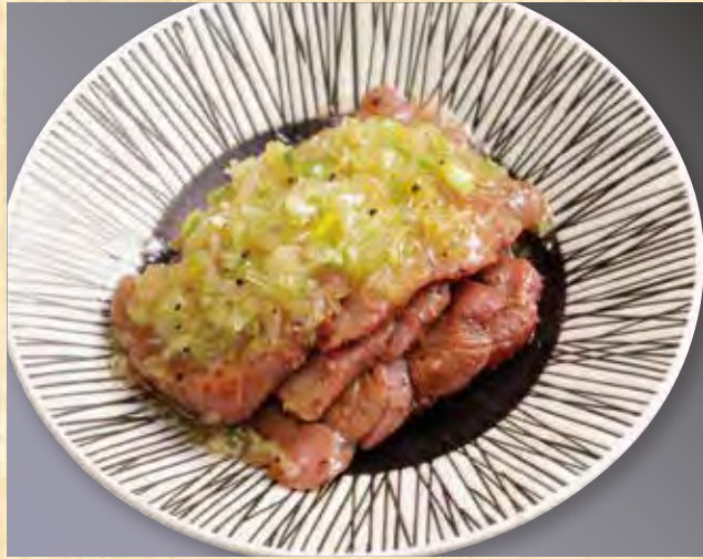
牛タン炙りネギまみれ 1,390円(税込1,502円)