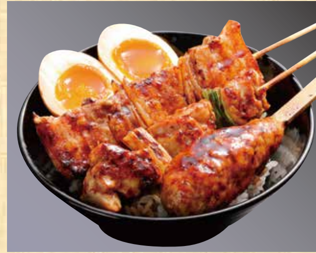
焼鳥親子丼 759円(税込820円)