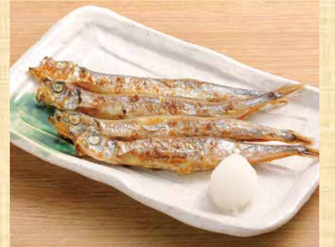
ししゃも炙り焼き 679円(税込734円)