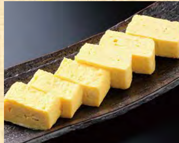
鶏スープの出し巻き玉子 589円(税込637円)