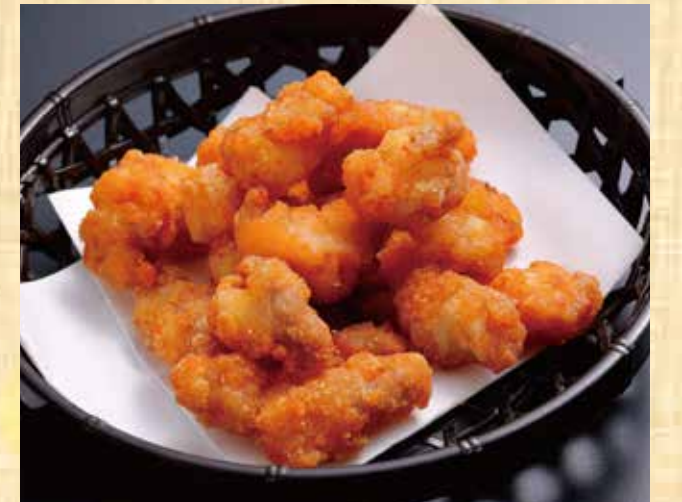
鶏軟骨から揚げ 608円(税込657円)