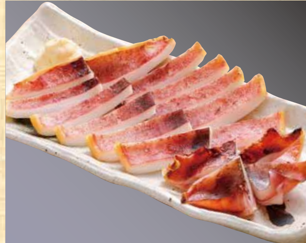
イカ一夜干し 1,188円(税込1,284円)