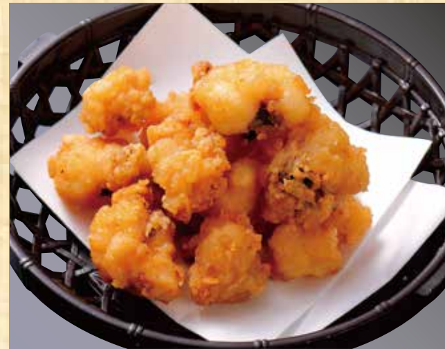
タコザンギ 618円(税込668円)