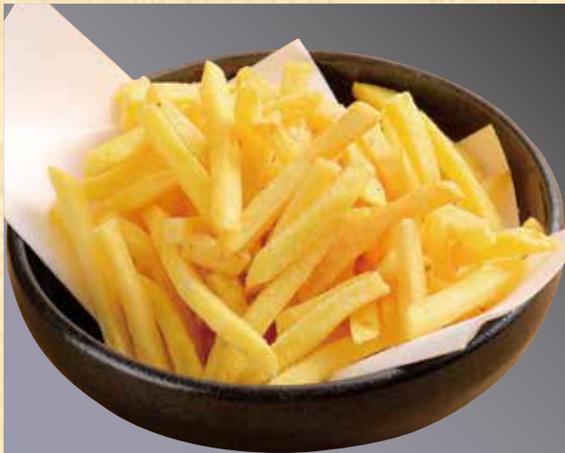
ポテトフライ うすしお・のりしお コンソメ・やみつきスパイス 各539円(税込583円)