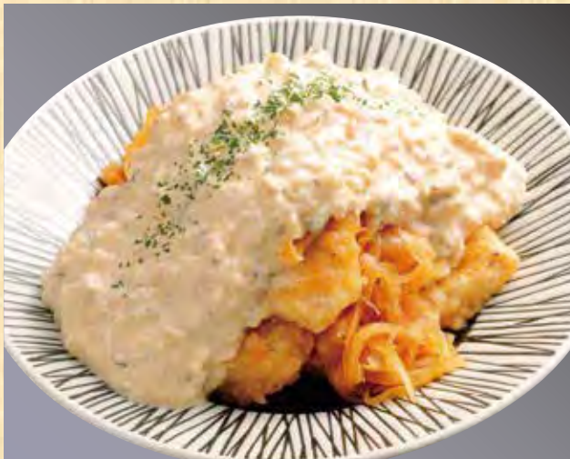
チキン南蛮 638円(税込690円)