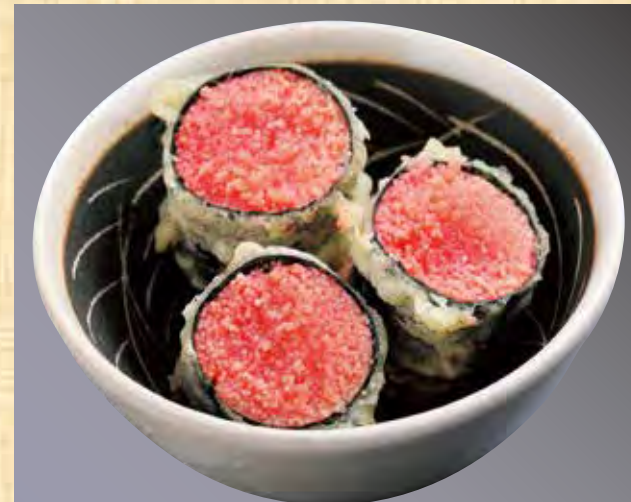
明太子おつまみ天ぶら 578円(税込625円)