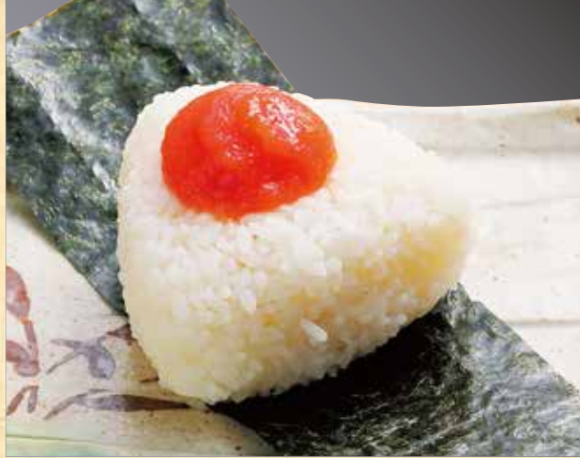
おにぎり 明太子 279円(税込302円)