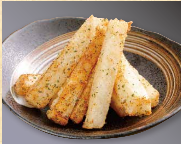
スパイシー長芋 578円(税込625円)