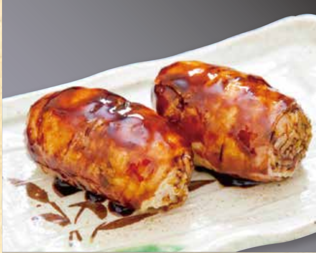
肉巻きおにぎり 499円(税込539円)