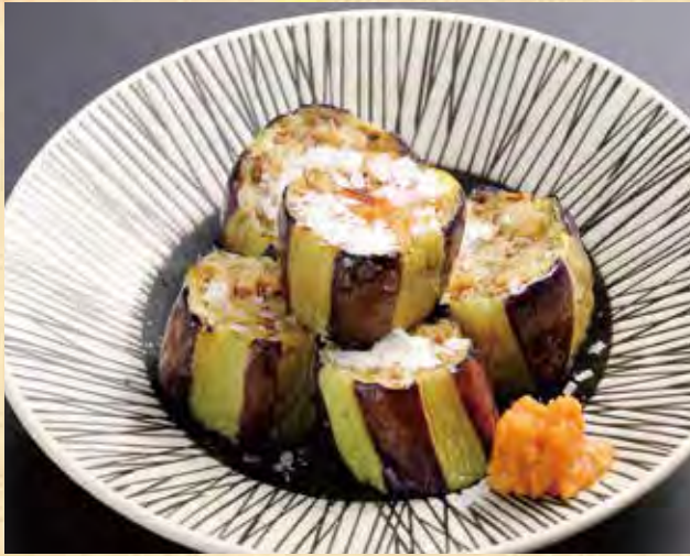
茄子焼き 山わさび味噌 499円(税込539円)