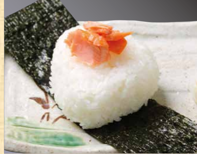
おにぎり 鮭 262円(税込283円)