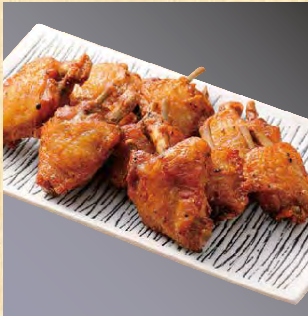
手羽チュー (3本)597円(税込645円) (4本)796円(税込860円) (5本)995円(税込1,075円) (8本)1,592円(税込1,720円)