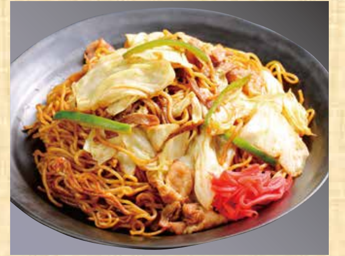
ソース焼きそば 699円(税込755円)