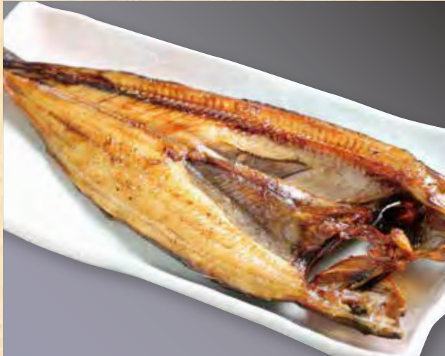
北海道産真ほっけハーフ 599円(税込647円)