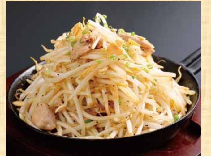
大盛りブラックペッパーもやし炒め 499円(税込539円)