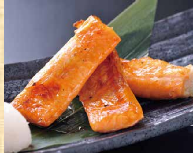
サーモンハラス焼き 739円(税込799円)