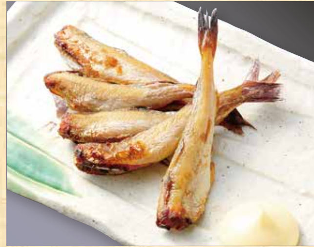
かんかい一夜干し(コマイ) 578円(税込625円)