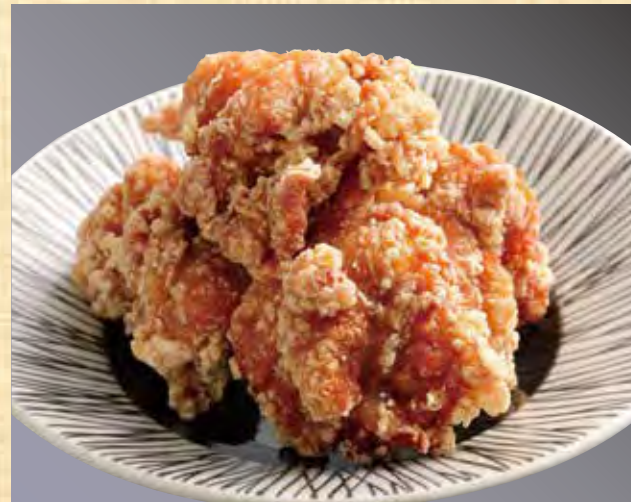
鶏よ魚よザンギ 648円(税込700円)