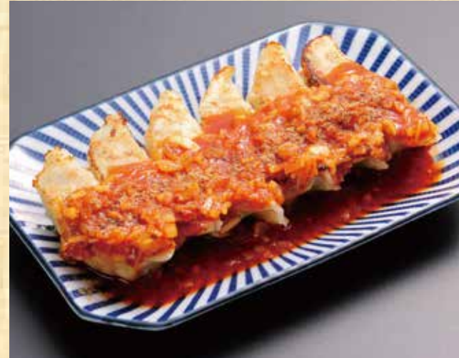
ピリ辛葱餃子(6個) 578円(税込625円)