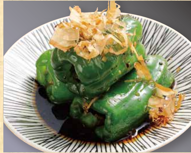
無限焼きピーマン 478円(税込517円)