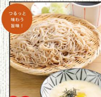
とろろざるそば 754円 (税込830円)