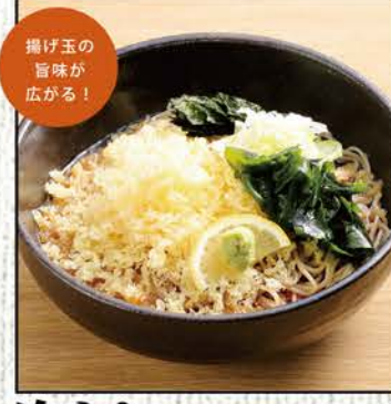
冷やし たぬき 681円 (税込750円)