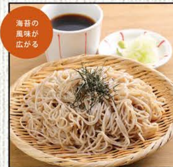
ざるそば 627円 (税込690円) 大盛ざるそば 727円 (税込800円)