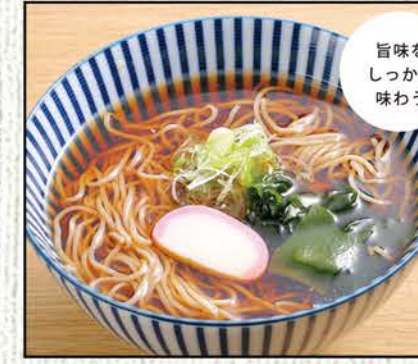
かけそば 590円 (税込649円)