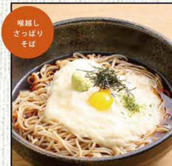
とろろそば 754円 (税込830円)