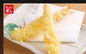
◆えび天 440円 (税込484円)