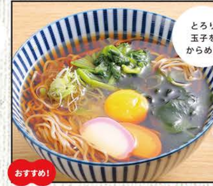
月見そば 681円 (税込750円)