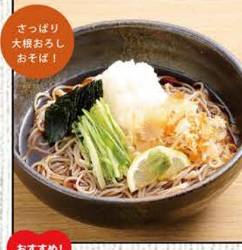
おろしそば 745円 (税込820円)