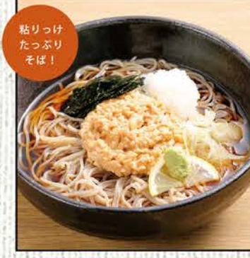
納豆そば 754円 (税込830円)