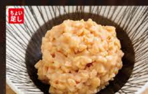
◆納豆 100円 (税込110円)