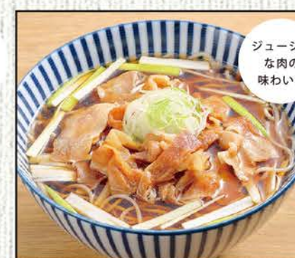
肉そば 890円 (税込979円)