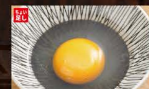
◆生玉子 68円 (税込75円)

北海道のそばと言えば、新得産のそば。 自然溢れる土地の中、朝晩の寒暖差の冷涼な気候が育てた、 風味豊かなそばです。 その土地を生かした味、新得のこだわりそばを使用。