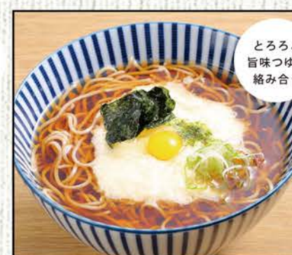
とろろそば 763円 (税込840円)