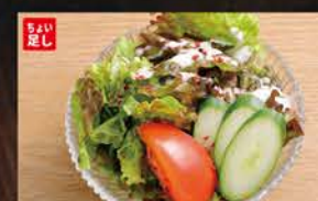
◆サラダ 245円 (税込270円)