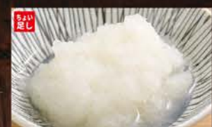
◆大根おろし 100円 (税込110円)