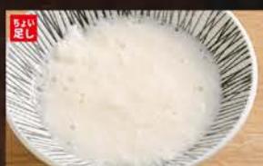
◆とろろ 200円 (税込220円)