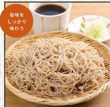
もりそば 545円 (税込600円) 大盛そば 636円 (税込700円)