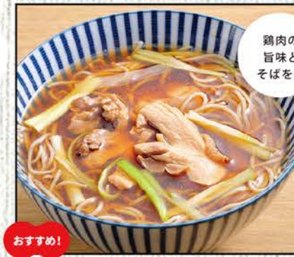
かしわそば 836円 (税込920円)