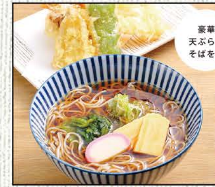
天ぷらそば 1,118円 (税込1,230円)