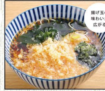
たぬきそば 690円 (税込759円)