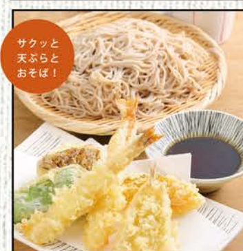
天ざるそば 1,118円 (税込1,230円)