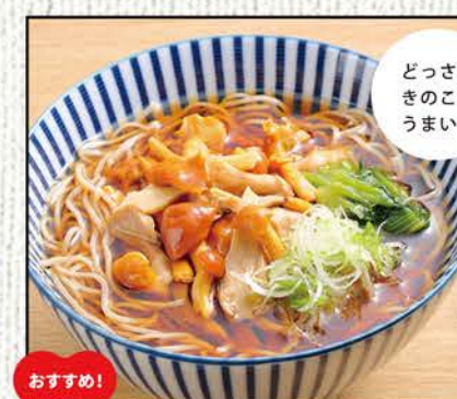
きのこそば 863円 (税込950円)