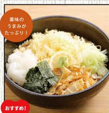
ちどりそば 754円 (税込830円)