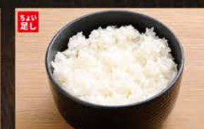
◆ごはん 200円 (税込220円)