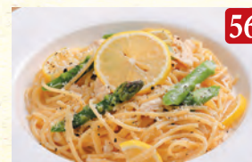
蒸し鶏とアスパラの レモンクリーム ¥1,090 (税込¥1,178)