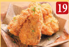
19 フライドチキン ¥600 (税込¥648)