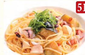
ヤリイカと茄子の和風 ¥1,090 (税込¥1,178)