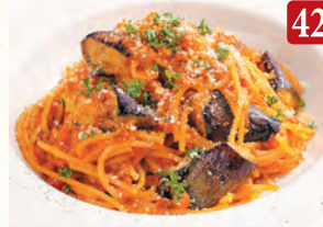
茄子のミートソース ¥1,190 (税込¥1,286)