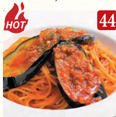
茄子とひき肉の 辛味スパゲッティ ¥1,280 (税込¥1,383)