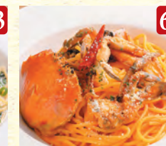
ワタリガニの トマトクリーム ¥1,550 (税込¥1,674)