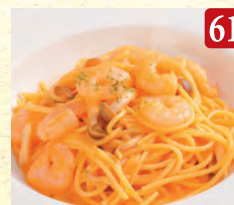
海老と3種キノコの トマトクリーム ¥1,350 (税込¥1,458)