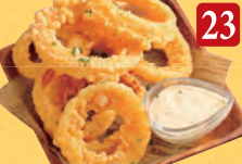
23 オニオンリング ¥540 (税込¥584)