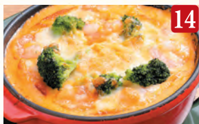
14 海老クリームドリア ¥1,230 (税込¥1,329)