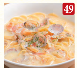
浅利と焦がしにんにくの クリームスープパスタ ¥1,150 (税込¥1,242)