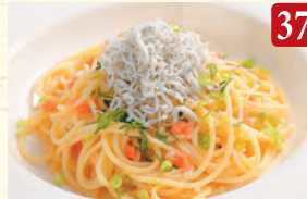
釜揚げシラスの 明太子ペペロンチーノ ¥1,250 (税込¥1,350)