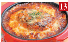
13 ハンバーグチーズカレードリア ¥1,230 (税込¥1,329)