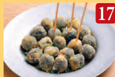
17 オリーブフライ ¥520 (税込¥562)