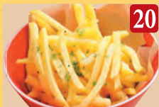
20 シューストポテト プレーン ¥530 (税込¥573)