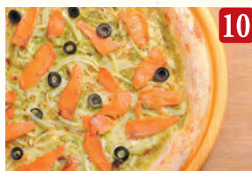
10 スモークサーモンの バジルクリーム ¥1,290 (税込¥1,394)