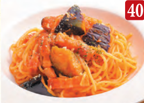
ベーコンと茄子の トマトソース ¥1,090 (税込¥1,178)