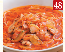
イカの旨辛トマト スープパスタ ¥1,150 (税込¥1,242)