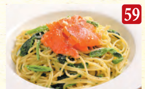
スモークサーモンと ほうれん草のクリーム ¥1,190 (税込¥1,286)