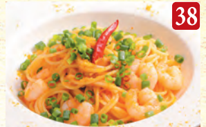
海老とカラシミの ペペロンチーノ ¥1,330 (税込¥1,437)