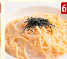
明太子クリーム ¥1,130 (税込¥1,221)