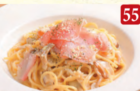
生ハムと3種キノコの クリーム ¥1,180 (税込¥1,275)