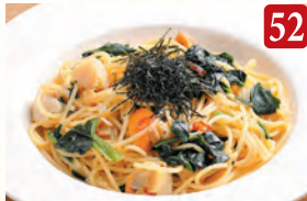
北海道産帆立と ホウレン草の和風 ¥1,200 (税込¥1,296)