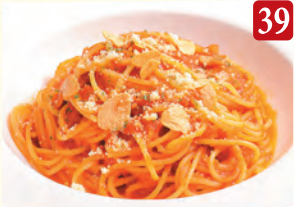
トマトとにんにく ¥990 (税込¥1,070)