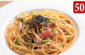
ベーコンと3種キノコの 和風 ¥990 (税込¥1,070)