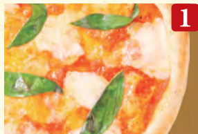
1 マルゲリータ ¥990 (税込¥1,070)

具材 2倍盛り + ¥350 (税込¥378) チーズ 2倍盛り + ¥250 (税込¥270) ハーフ & ハーフ + ¥200 (税込¥216) ※プレミオは対象外