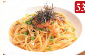
タラコと3種キノコの和風 ¥1,150 (税込¥1,242)