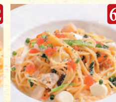
北海道産帆立と モッツアレラのタラコクリーム ¥1,350 (税込¥1,458)