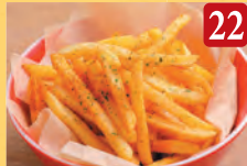
22 シューストポテト チリガーリック ¥620 (税込¥670)