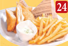
24 フィッシュ&チップス ¥630 (税込¥681)