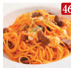
牛肉ラグーと モッツアレラのトマトソース ¥1,390 (税込¥1,502)