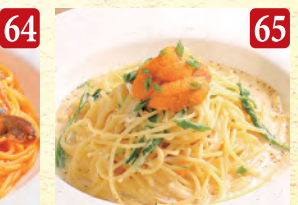
雲丹の鰹沢クリーム ¥1,740 (税込¥1,880)