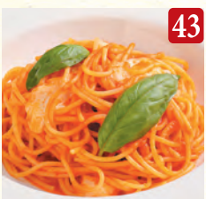
とろーりモッツアレラの トマトソース ¥1,200 (税込¥1,296)