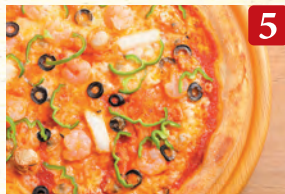
5 シーフードミックス ¥1,150 (税込¥1,242)