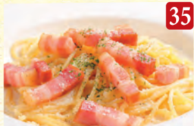
厚切りベーコンの カルボナーラ ¥1,100 (税込¥1,188)