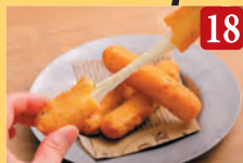
18 のびるモッツアレラチーズフライ ¥580 (税込¥627)