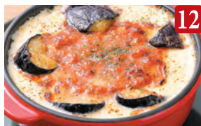
12 茄子のミートドリア ¥1,150 (税込¥1,242)