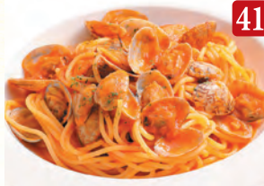
ボンゴレロッツ ¥1,190 (税込¥1,286)