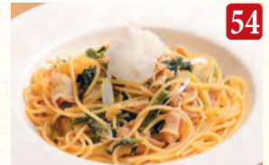
八雲ポークの柚子胡椒 ¥1,280 (税込¥1,383)