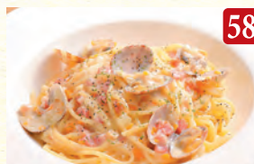
北海道産帆立とアサリの クラムチャウダー風 ¥1,350 (税込¥1,458)