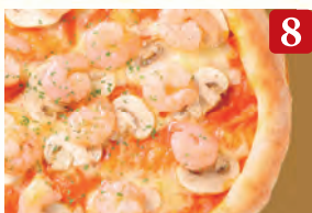
8 海老とマッシュルームの トマトクリーム ¥1,220 (税込¥1,318)