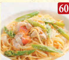
北海道産帆立と アスパラのクリーム ¥1,350 (税込¥1,458)