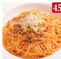
パルミジャーノ・レジャーノ のミートソース ¥1,390 (税込¥1,502)