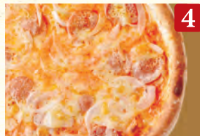
4 サラミとオニオンの トマトソース ¥1,090 (税込¥1,178)