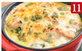
11 バジルチキンクリームドリア ¥1,080 (税込¥1,167)