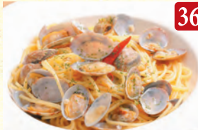
ボンゴレビアンコ ¥1,200 (税込¥1,296)