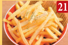
21 シューストポテト コンソメ ¥620 (税込¥670)