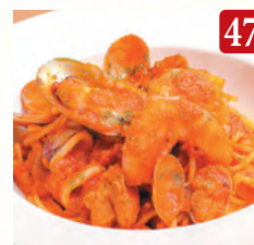
魚介たっぷり ペスカトーレ ¥1,580 (税込¥1,707)