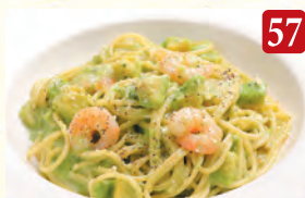
海老とアボカドのクリーム ¥1,200 (税込¥1,296)