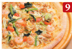
9 ピッツァ・アンジェリーナ ¥1,270 (税込¥1,372)